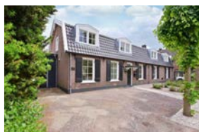
ZEVENEND 53 - 55

Makelaars in Laren, Blaricum en omgeving