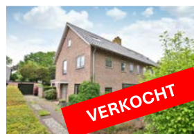
DE DISSEL 6