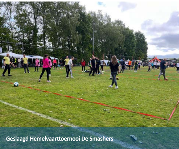
Geslaagd Hemelvaarttoernooi De Smashers