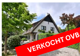
OUDE KERKWEG 37