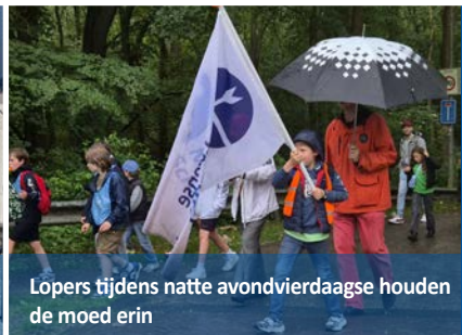
Lopers tijdens natte avondvierdaagse houden de moed erin