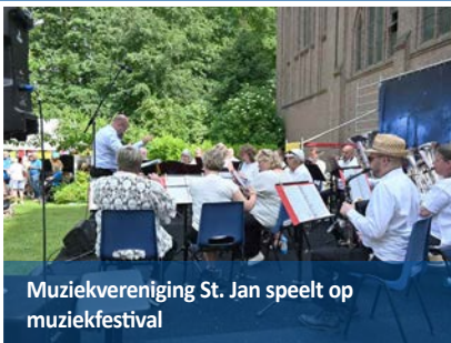
Muziekvereniging St. Jan speelt op muziekfestival