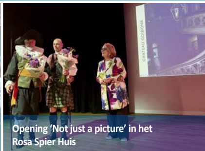
Opening 'Not just a picture' in het Rosa Spier Huis