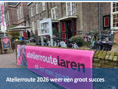
Atelierroute 2026 weer een groot succes