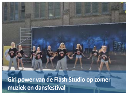
Girl power van de Flash Studio op zomer muziek en dansfestival