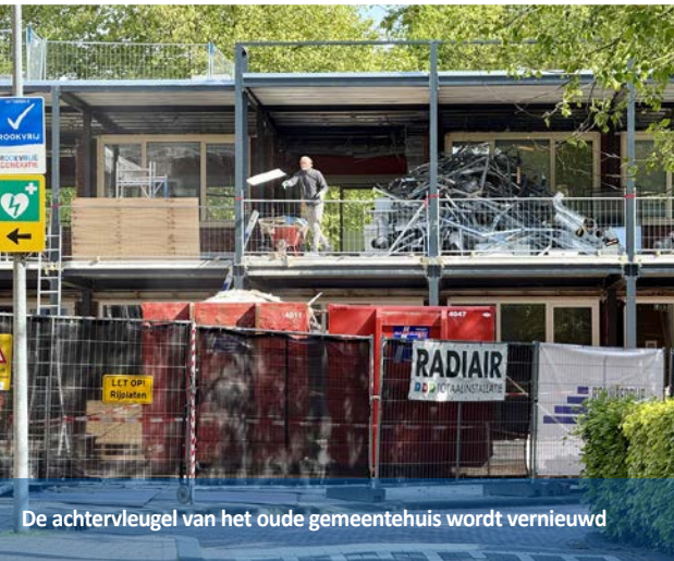
De achtervleugel van het oude gemeentehuis wordt vernieuwd