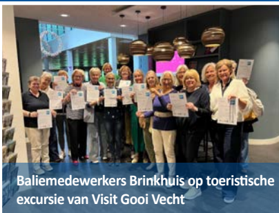
Baliemedewerkers Brinkhuis op toeristische excursie van Visit Gooi Vecht