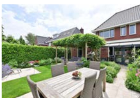
VIERKANTE BOSJE 59