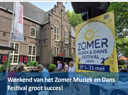
Weekend van het Zomer Muziek en Dans Festival groot succes!