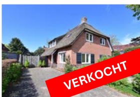
OUDE KERKWEG 18