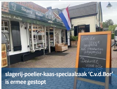
slagerij-poelier-kaas-specialzaak 'C.v.d.Bor' is ermee gestopt