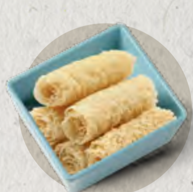
crispy tofu skin roll 響鈴捲