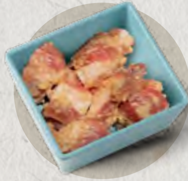
new garlic pork rib 蒜香排骨 (煮3分鐘)