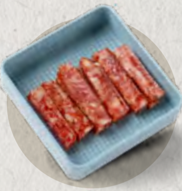
new chinese sausage 臘腸