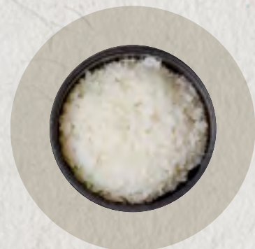
steamed rice 白飯