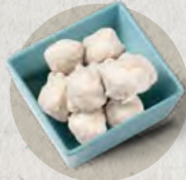
squid ball 花枝丸