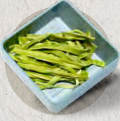
new dry celtuce 貢菜