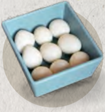
quail egg 鵪鶉蛋