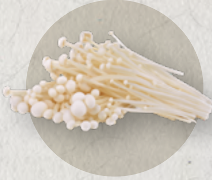
enoki mushroom 金針菇