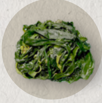
new baby kelp 有機海帶苗