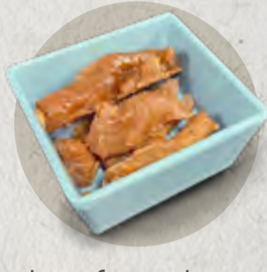
beef tendon 鹵牛筋