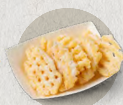
re hokkaido potato chips 北海道風烤薯片