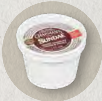
new ice cream cup (limit 1 per person) (please ask your server for flavours) 冰淇淋