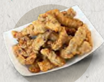
new crispy pork 小酥肉