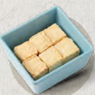
fish tofu 魚豆腐