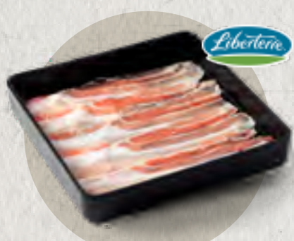
pork belly 全自然豬五花