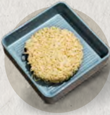
hot pot noodle 非油炸火鍋麵