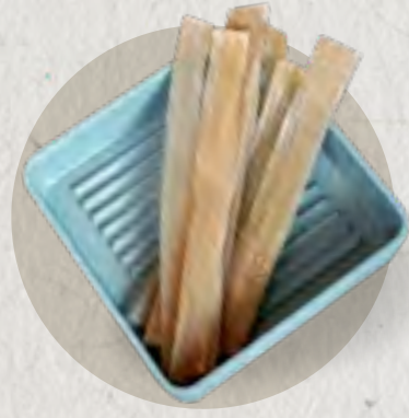
flat glass noodle 火鍋苕皮