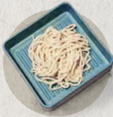
new noodle 手擀麵