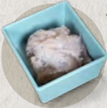
shrimp paste 蝦滑