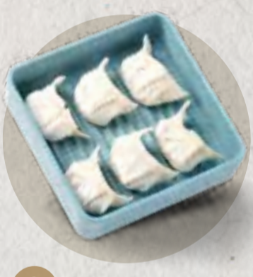
® dumplings 手工餃子