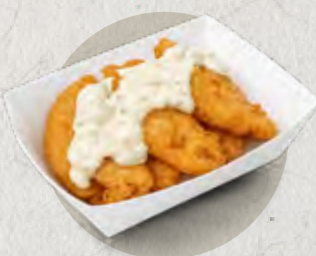
new golden crunch fish bites 黄金脆炸鱼柳