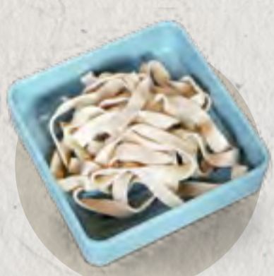
dried tofu 千張豆腐絲