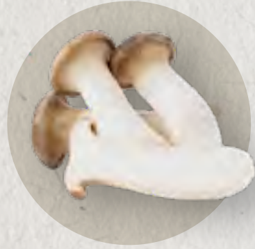
king oyster mushroom 皇子菇