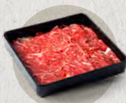
selected sirloin 精選西冷肥牛