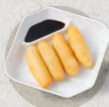
deep fried rice cake with brown sugar 紅糖糍粑