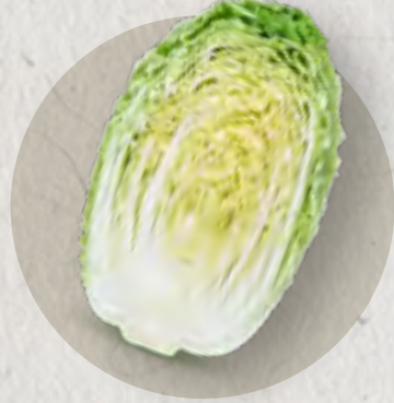
nappa cabbage 白菜