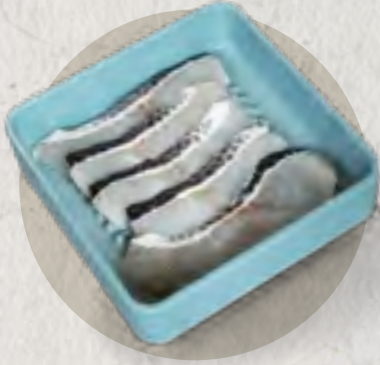
snakehead fish 黑魚片