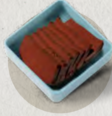
new duck blood tofu 鴨血