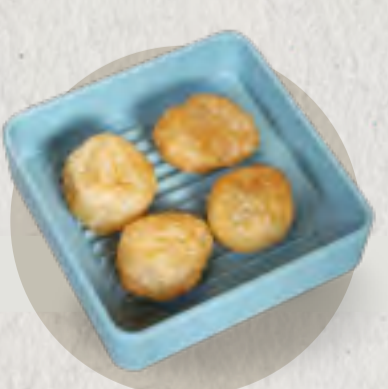
deep fried dough 炸麵筋