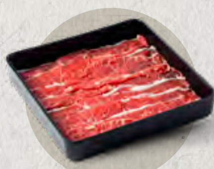
premium beef chuck 頂級雪花牛肉