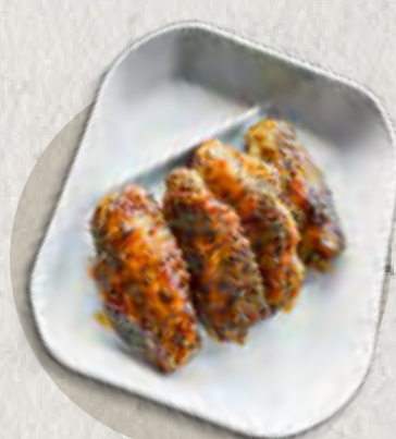
re nagoya style chicken wings 名古屋風炸雞翅