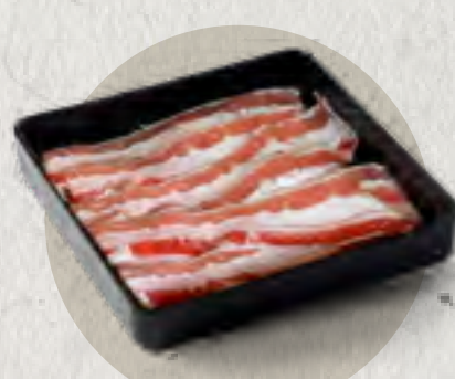
beef brisket 特選肥牛