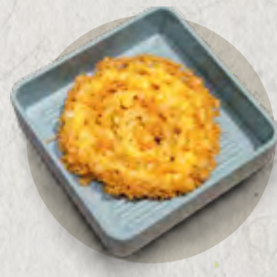
new deep fried egg 炸蛋