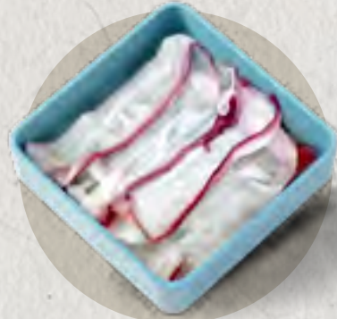
new octopus 八秒章魚