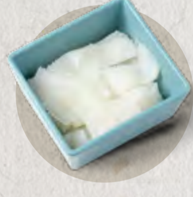
beef tripe 牛百葉