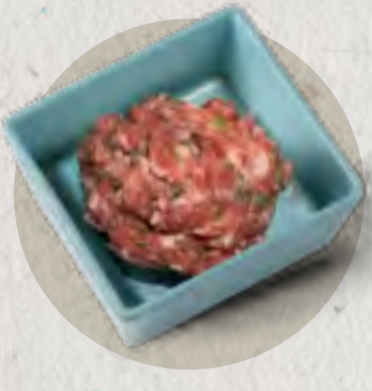
new cilantro meat paste 香菜丸子