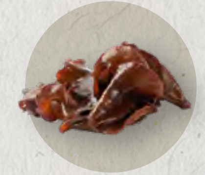
black fungus 木耳