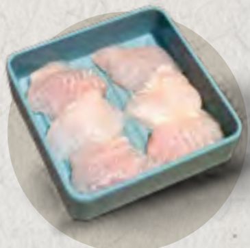
basa fish 巴沙魚