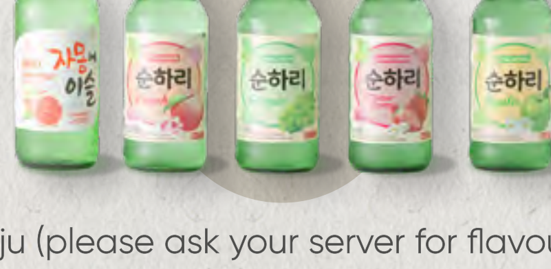
soju (please ask your server for flavours) 韓國焼酒