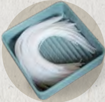
japanese glass noodle 日式粉絲