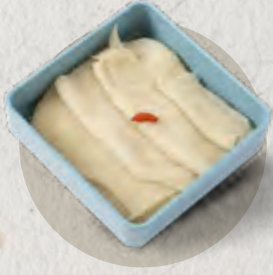
new wide-cut beef tripe 毛肚