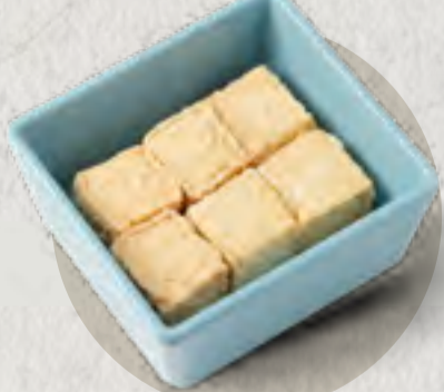
fish tofu 魚豆腐