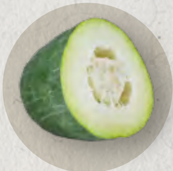
winter melon 冬瓜