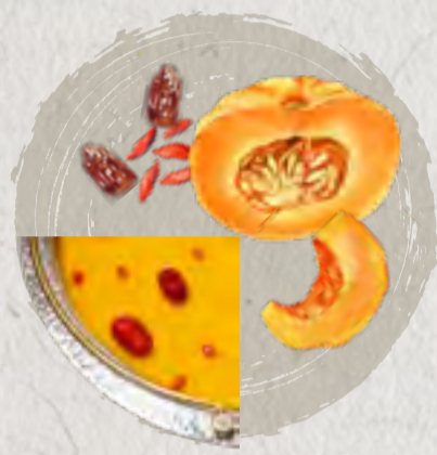
new golden pumpkin soup 南瓜金湯