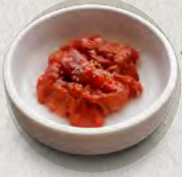
new Spicy Beef 麻辣牛肉