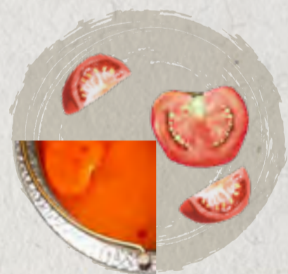
tomato soup 番茄高湯