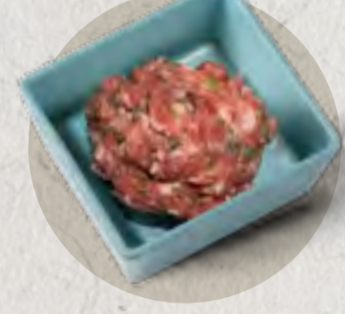
cilantro meat paste 香菜丸子