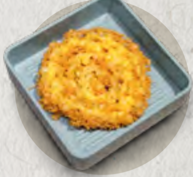
new deep fried egg 炸蛋