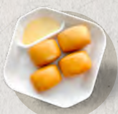
new Golden Fried Buns 黄金饅頭