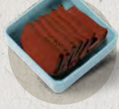
new duck blood tofu 鴨血