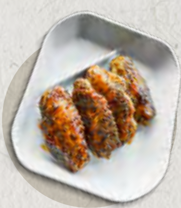
re nagoya style chicken wings 名古屋風炸雞翅