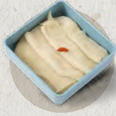
new wide-cut beef tripe 毛肚