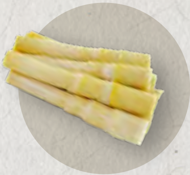
bamboo shoot 筍尖