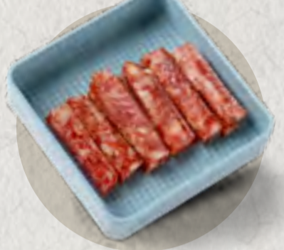
new chinese sausage 臘腸