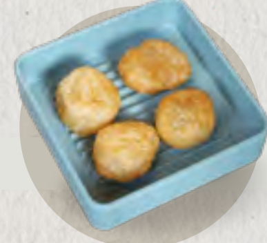
deep fried dough 炸麵筋