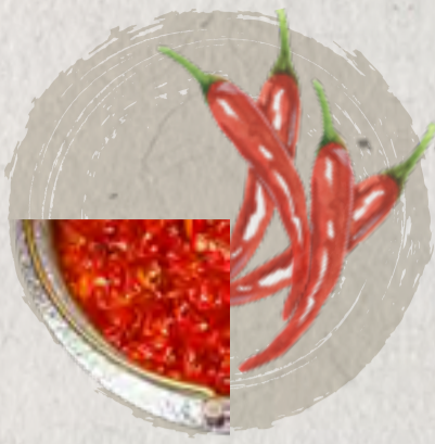
new signature szechuan spicy soup