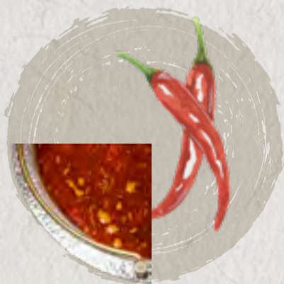
spicy soup 清油麻辣鍋