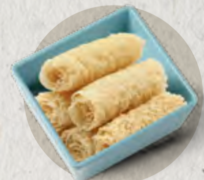
crispy tofu skin roll 響鈴捲