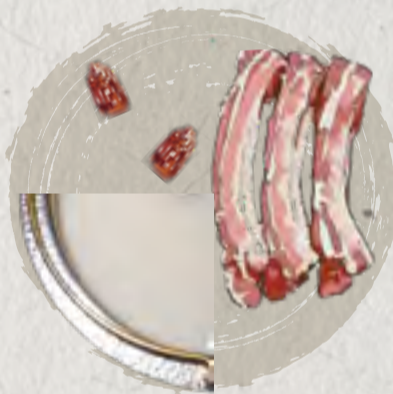
new pork bone soup 猪骨高湯