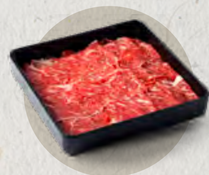
selected sirloin 精選西冷肥牛