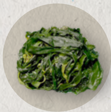
new baby kelp 有機海帶苗