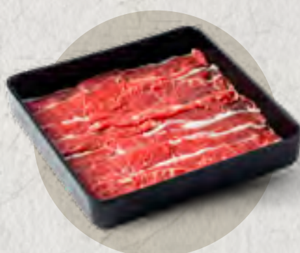
premium beef chuck 頂級雪花牛肩肉