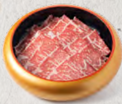
wagyu (US・AUS) 和牛 (美國・澳洲)