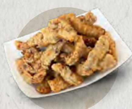
new crispy pork 小酥肉