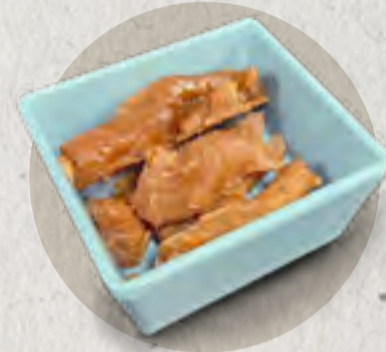
beef tendon 鹵牛筋