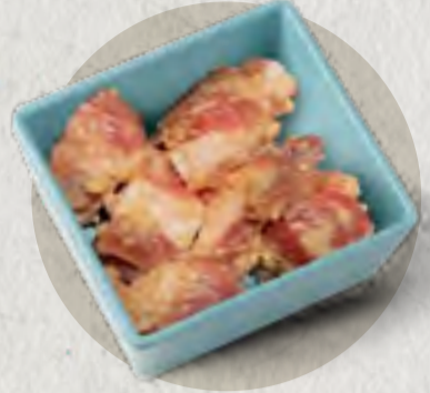
new garlic pork rib 蒜香排骨 (煮3分鐘)