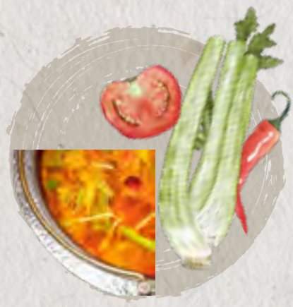
guizhou sour soup