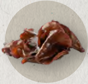
black fungus 木耳