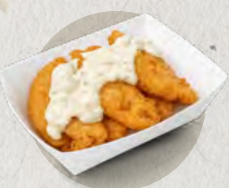
new golden crunch fish bites 黄金脆炸鱼柳