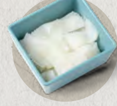
beef tripe 牛百葉