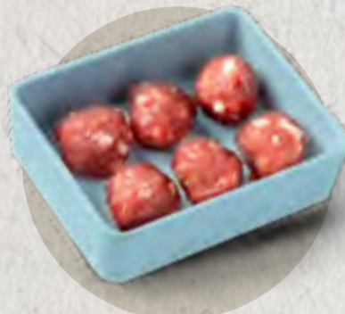
beef ball 牛肉丸