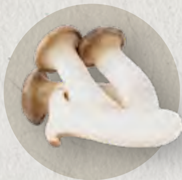
king oyster mushroom 皇子菇