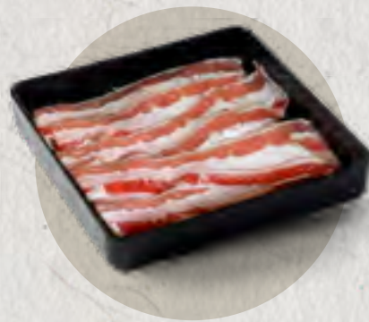
beef brisket 肥牛