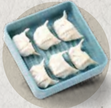
® dumplings 手工餃子