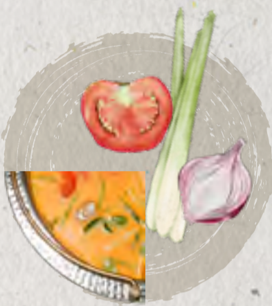
new tom yum soup 冬陰功湯