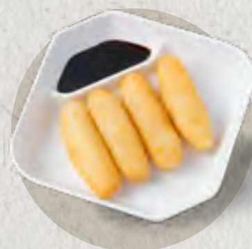
deep fried rice cake with brown sugar 紅糖糍粑