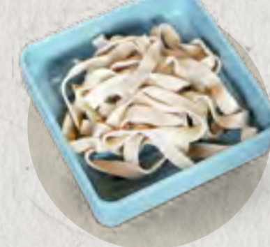
dried tofu 千張豆腐絲