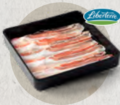
pork belly 全自然豬五花