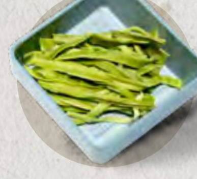
new dry celtuce 貢菜