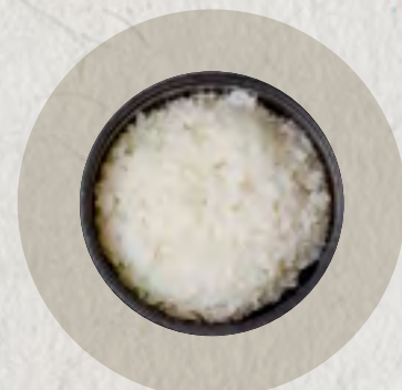
steamed rice 白飯