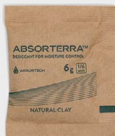
60 x 50 公釐