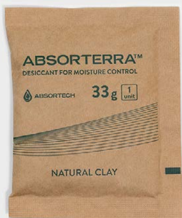
100 x 80 公釐