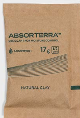
90 x 60 公釐