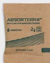
45 x 35 公釐