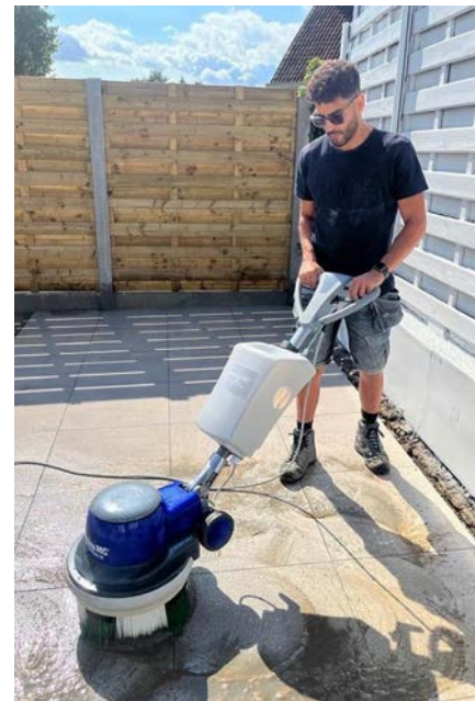
De Terrazza TMC® Kit werkt volledig zonder chemicaliën en gebruikt enkel water in combinatie met borstels met lange en korte haren.