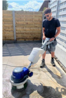
Das Terrazza TMC® Kit arbeitet vollständig ohne Chemikalien und verwendet nur Wasser in Kombination mit Bürsten mit langen und kurzen Härchen.

„Was dieses Gerät macht, kann man nicht mit Hochdruck vergleichen“