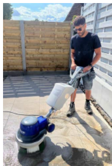
La Terrazza TMC® Kit fonctionne entièrement sans produits chimiques et utilise uniquement de l'eau combinée à des brosses à poils longs et courts.

« Ce que cela fait, ce n'est pas comparable à un nettoyeur haute pression »