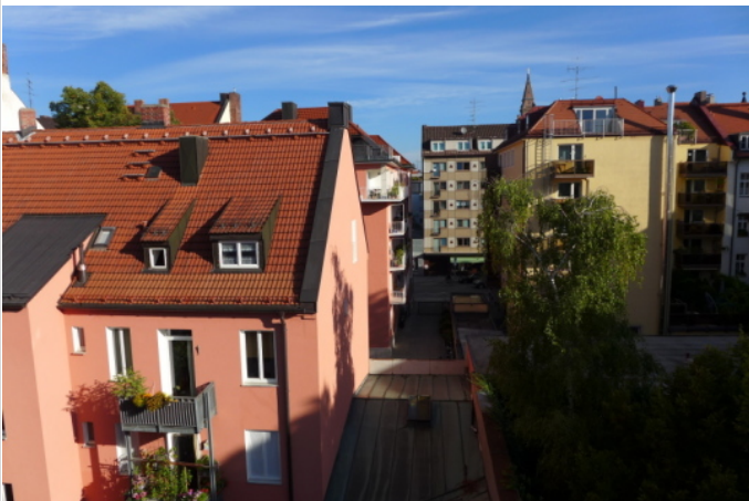
Blick aus dem Fenster