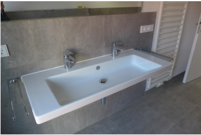
Bad mit Wanne

Zimmer: 3,00 Wohnfläche ca.: 108,36 m 2 Kaltmiete: 2.750,00 EUR (zzgl. Nebenkosten) Gesamtmieta: 3.050,00 EUR