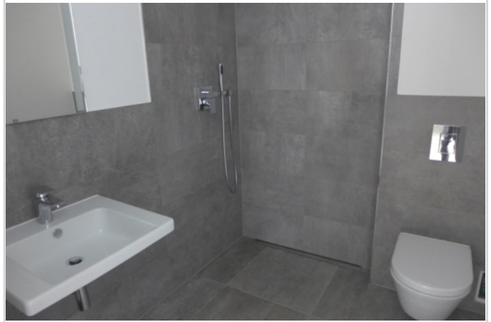
Gäste - Duschbad