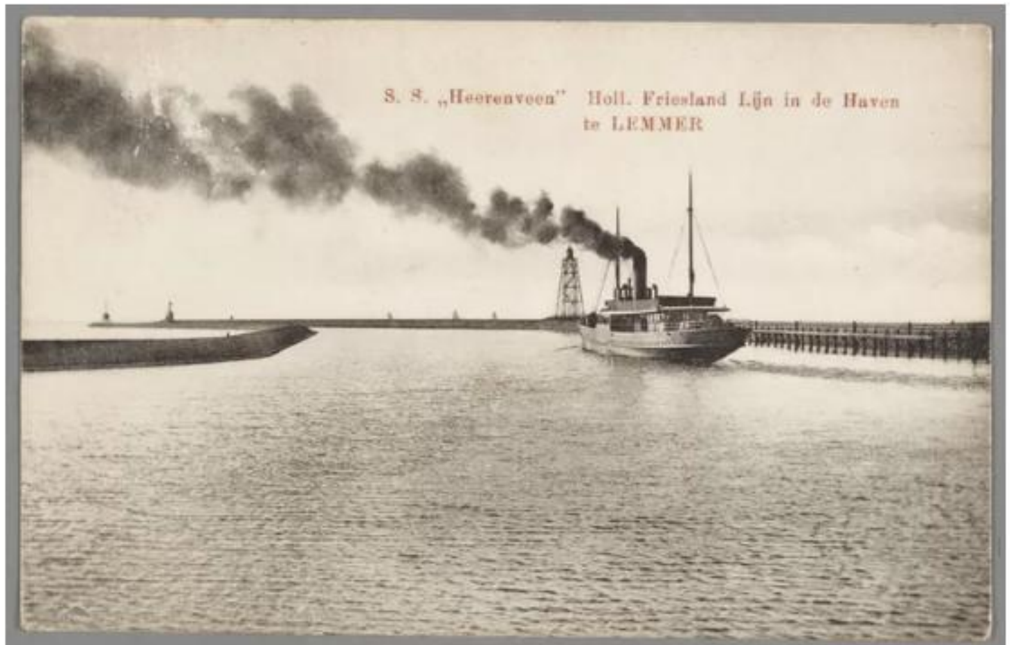
▲ Stoomboot de Heerenveen waar Dinkla mee gered werd.

De stuurman springt het water in. Hij trekt en duwt de man hun stoomboot op. Met hem varen ze terug. Aan wal ontsteekt de drenkeling, die Dinkla zegt te heten, in een mantra: „O, vraag me toch niets! Was ik ook maar verdronken!”