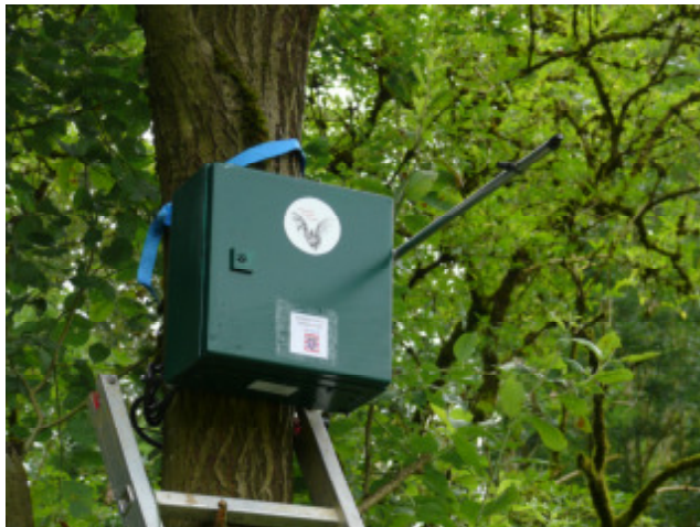
Kontinuierlicher Detektor im Wald

Eigentümer/in der Fläche: Land Hessen und Forstbetrieb Finkenloch