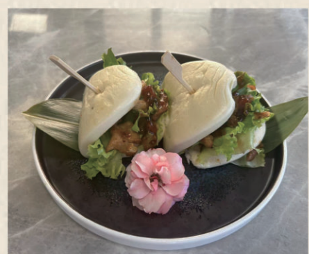
618 GUAN BAO