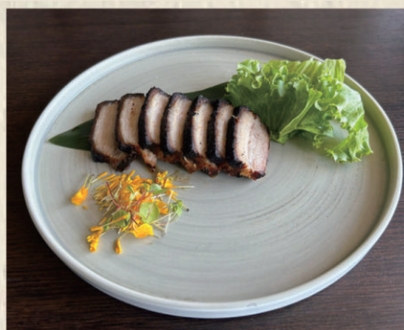
902 BOSSAM Pancetta di maiale arrosto in salsa di soia aromatizzato . 11.00€