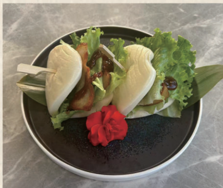
617 GUAN BAO

Pane cotto al vapore con carne di maiale