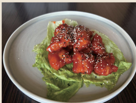
922 CHICKEN IN SALSA COREANA Pollo in salsa agrodolce coreana 9.00€