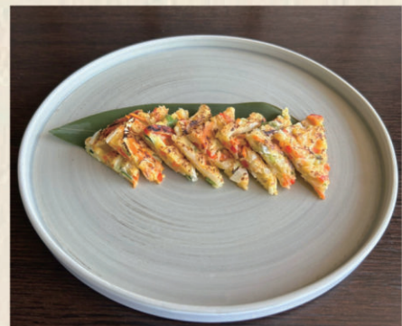
615 KIMCHI JEON