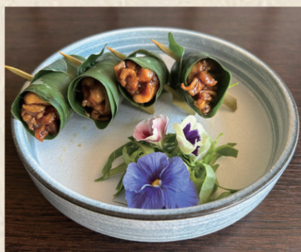
904 DALG CHASHU Cosce di pollo disossate 11.00€