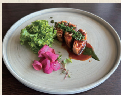
905 BLACK COD.SALMON Salmone marinato in salsa di soia fermentata olio di sesamo In salsa al tè verde e salsa gochujang piccante 13.00€