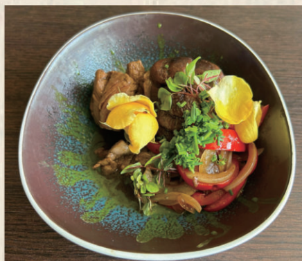
903 BULGOGHI Straccetti di black Angus saltati con cipollotti e funghi in salsa di sesamo al tè verde. 13.00€