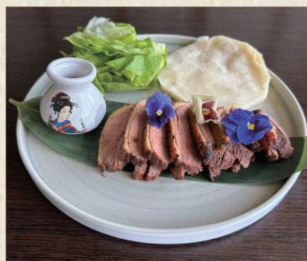
901 CHACHUOLI Anatra arrosto chashu accompagnato con kimchi 12.00€