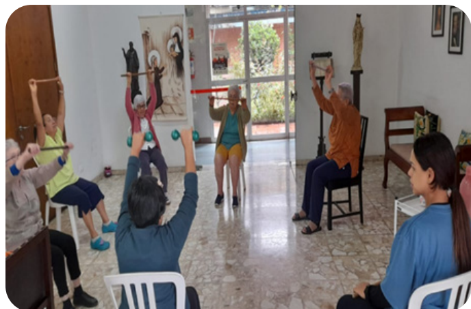
Cuidando da nossa saúde