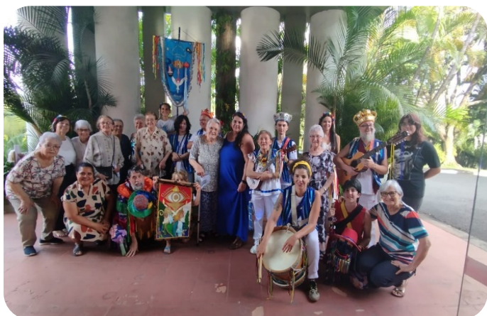
Folia de Reis: Momento de louvor ao menino Deus.