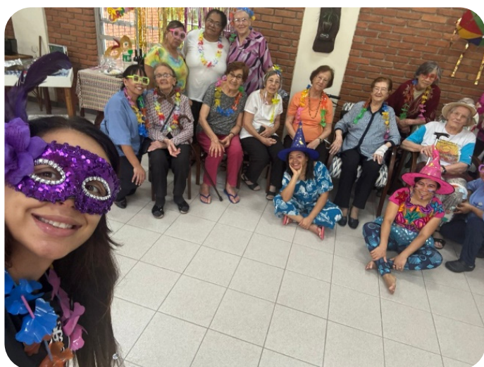
Festa de Carnaval