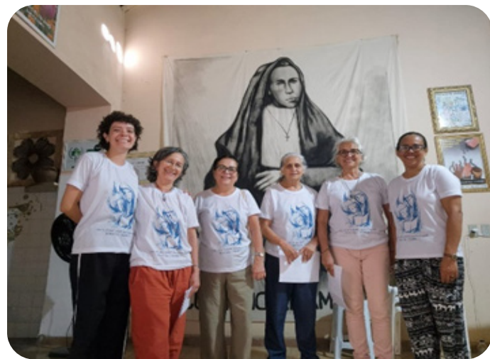
Nossa primeira casa, em 1976

Alix! Qual? Aquela espiritualidade que nos move para fazer o bem e fazê-lo bem! Percorrer esses caminhos com minhas irmãs que aqui estão, é olhar para trás com gratidão, é olhar também para o hoje que nos faz estar aqui, e quem sabe do amanhã? Ninguém, mas é certo que ele dependerá do nosso hoje!