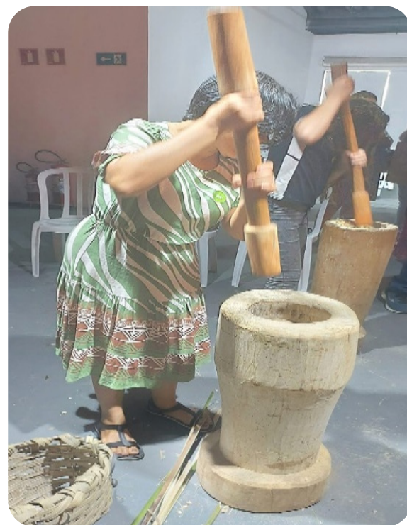
Tarde de lazer do grupo de jovens da Paróquia São Pedro Fourier