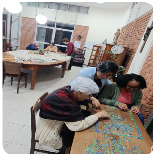
Trabalhando a memória