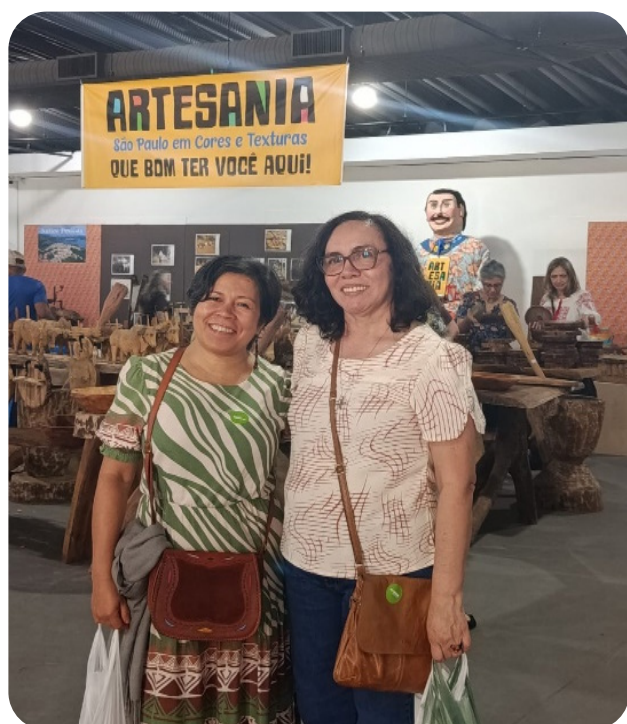
Visitando a feira de artesanato da economia solidária no Parque Água Branca Museu do Som. Belíssimos trabalhos das artesãs e (os). Participamos da oficina de paçoca no pilão.