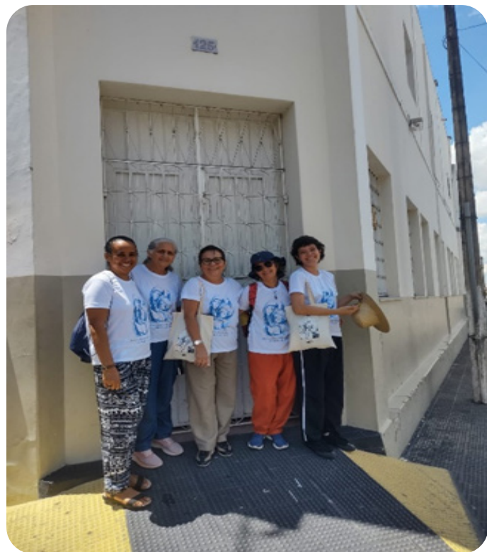
Escolinha Madre Alix - Primeira escola em Juazeiro

“Juazeiro é, na beira da estrada, abrigo e pousada ao pobre que vive sem onde morar. Juazeiro é, esperança danada, que tanto padece, mas nunca esquece de brotar.”