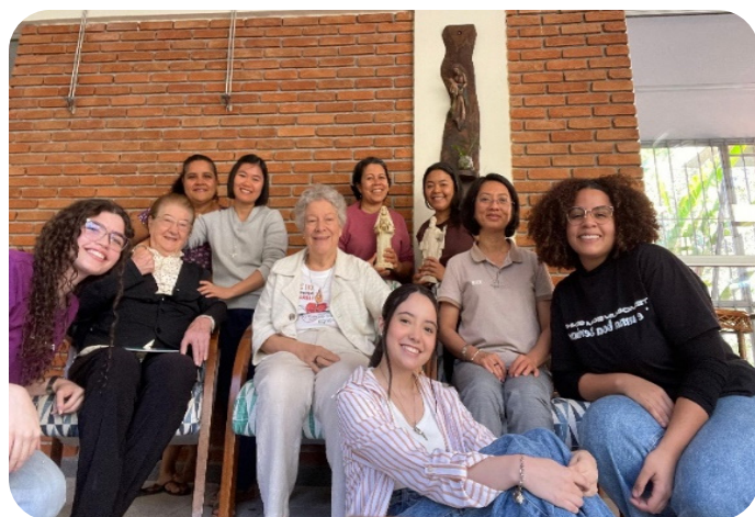
Visita e entrevista das jovens da Paróquia São Pedro Fourrier com algumas irmãs por ocasião da Festa do padroeiro. (460 anos do nascimento de São Pedro Fourrier).