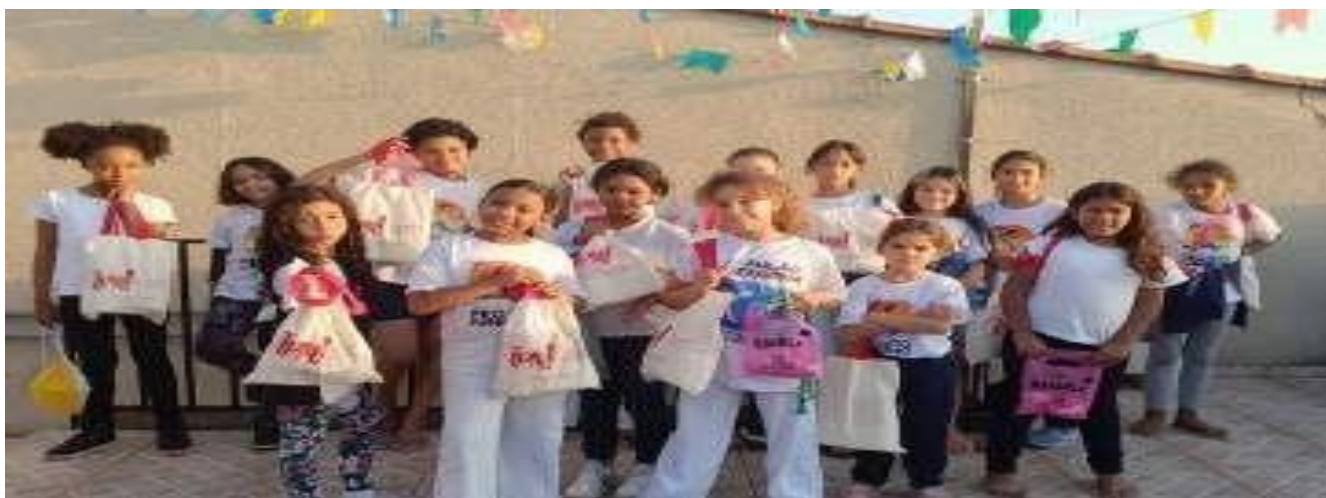
07/06 Festa dos Aniversariantes mês de Maio – Festa do Pijama