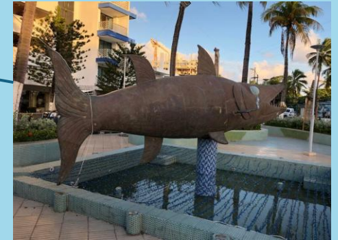
CENTRO DE LA CIUDAD