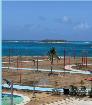
SARIE BAY PARK