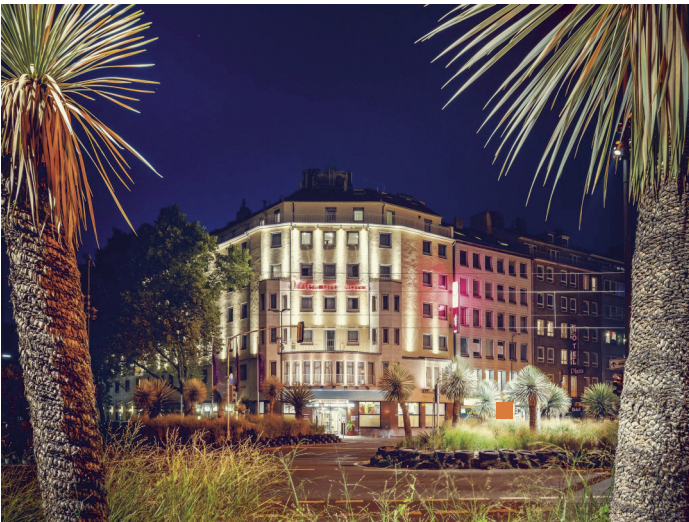
MERCURE Hotel Düsseldorf City Center

Mercure Hotel Düsseldorf City Center Stresemannplatz 1 40210 DUESSELDORF Deutschland Telefon: +49 (0)211 35 54 0 E-Mail: h5373-sb1@accor.com