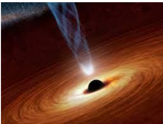
Zwart gat in de maan, ( Foto 2022 NOS.nl)

Mocht daaraan behoefte bestaan, dan kunt u zonder toestemming de column overnemen in kerkblad of op website