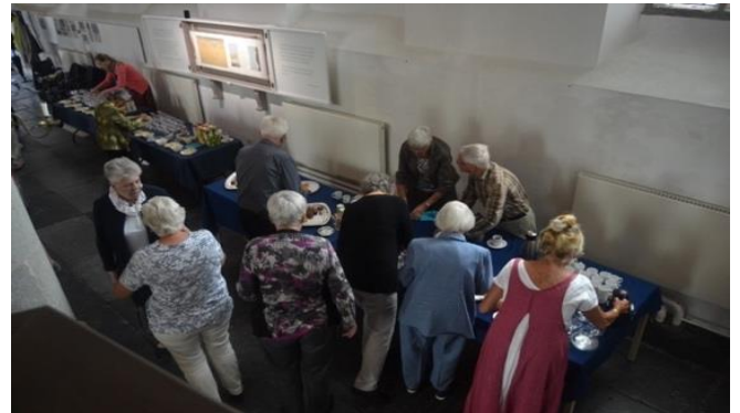
De catering was weer prima verzorgd, hoe flikken die dames dat toch steeds weer?