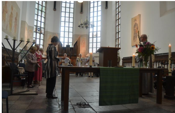
Het plechtige moment van de losmaking.