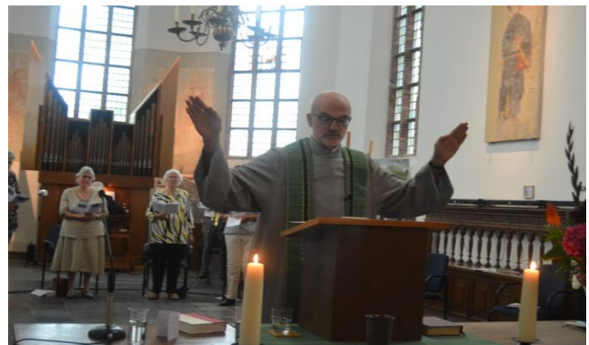
Voorlopig zijn laatste zegen voor onze gemeente