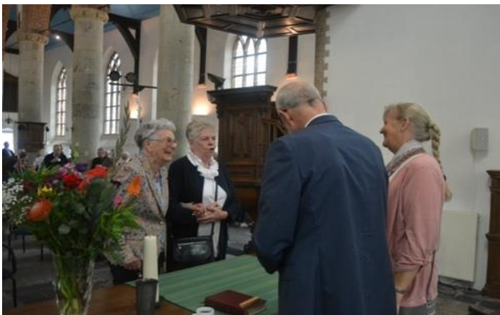
Tenslotte, ons oudste gemeentelid neemt met gulle lach afscheid van het domineespaar