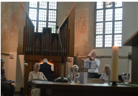
De trompettist in actie.