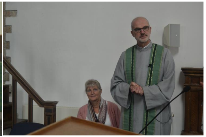
en een aandachtig luisterend paar.