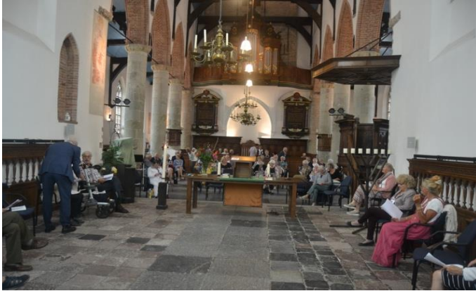
Een mooi overzicht van de kerk en de gemeente.