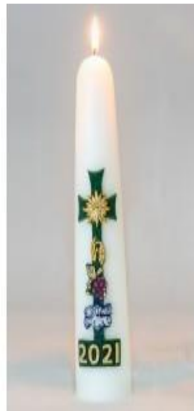
zon, druiven en vissen

Zondag 11 april , 10.00 uur ds. K. Vos uit Huizen kleur: wit collecte: 1. diaconie "Mensenkinderen" 2. kerk