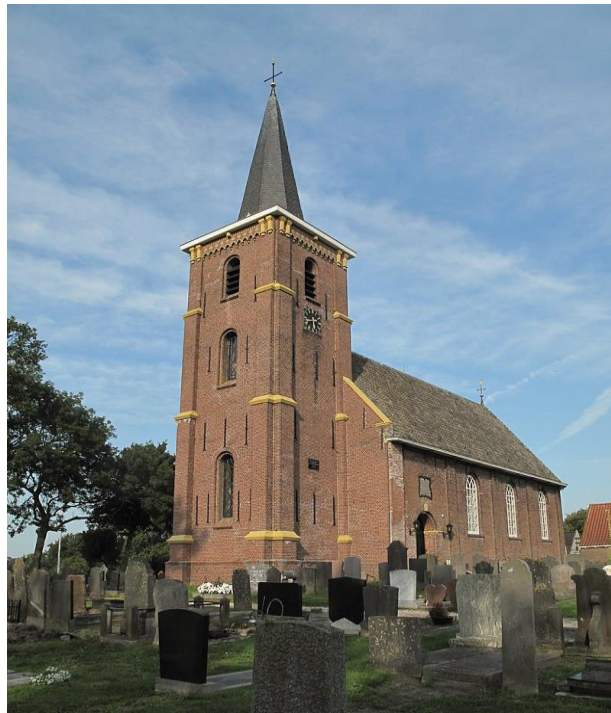
St. Ceciliakerk Lekkum