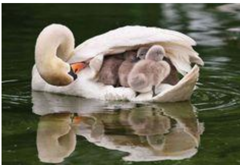
Moeder natuur, zo verzorgen zij hun jongen