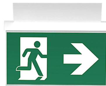
Abbildungen AKM Decke