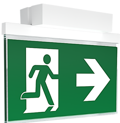
Abbildung AKG Decke