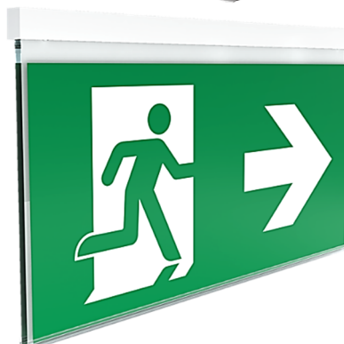
Abbildung AKX Wand