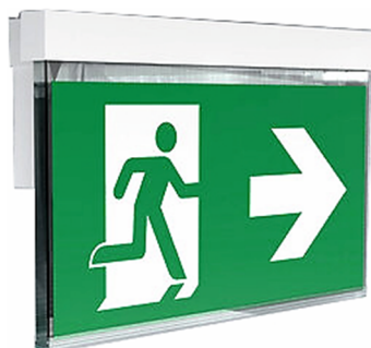
Abbildungen AKM Wand