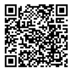
Church Parking Map

성당 주차장은 장애인, 어르신, 어린 아이들이 있는 가정을 위해서 사용됩니다. 다른 분들은 Street Parking을 이용해주세요.