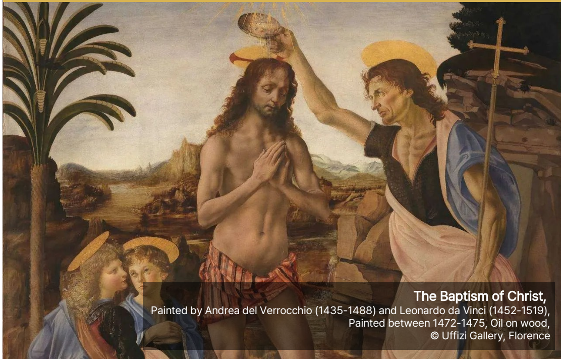
The Baptism of Christ, Painted by Andrea del Verrocchio (1435-1488) and Leonardo da Vinci (1452-1519), Painted between 1472-1475, Oil on wood

오늘은 주님 세례 축일입니다. 하느님께서 요르단강에서 세례를 받으신 예수님께 성령을 내리시고, 당신의 아들로 선포하십니다. 물과 성령으로 세례를 받아 하느님의 자녀가 된 우리도 만민의 주님께서 전해 주신 평화의 복음을 전하기로 다짐합니다.