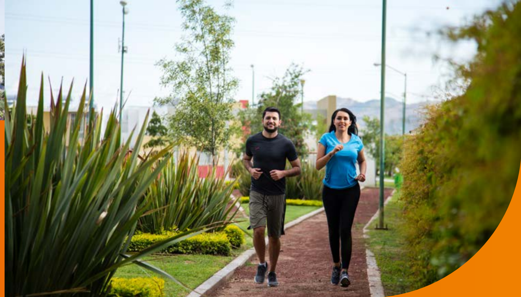
16,300 M 2 DE ÁREAS VERDES

Las imágenes mostradas son ilustrativas, puede haber cambios sin previo aviso. Favor de consultar con tu asesor inmobiliario.