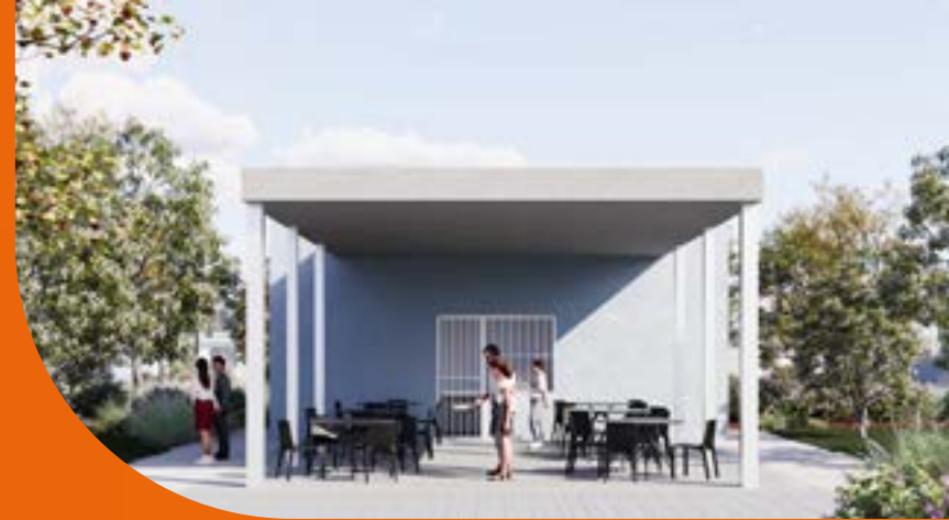
TERRAZAS PARA EVENTOS