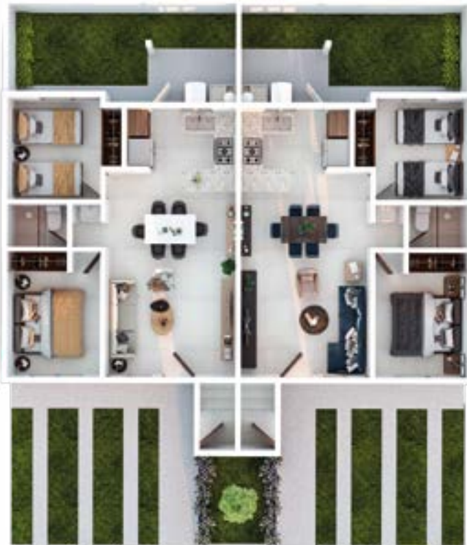
CASA PLANTA BAJA