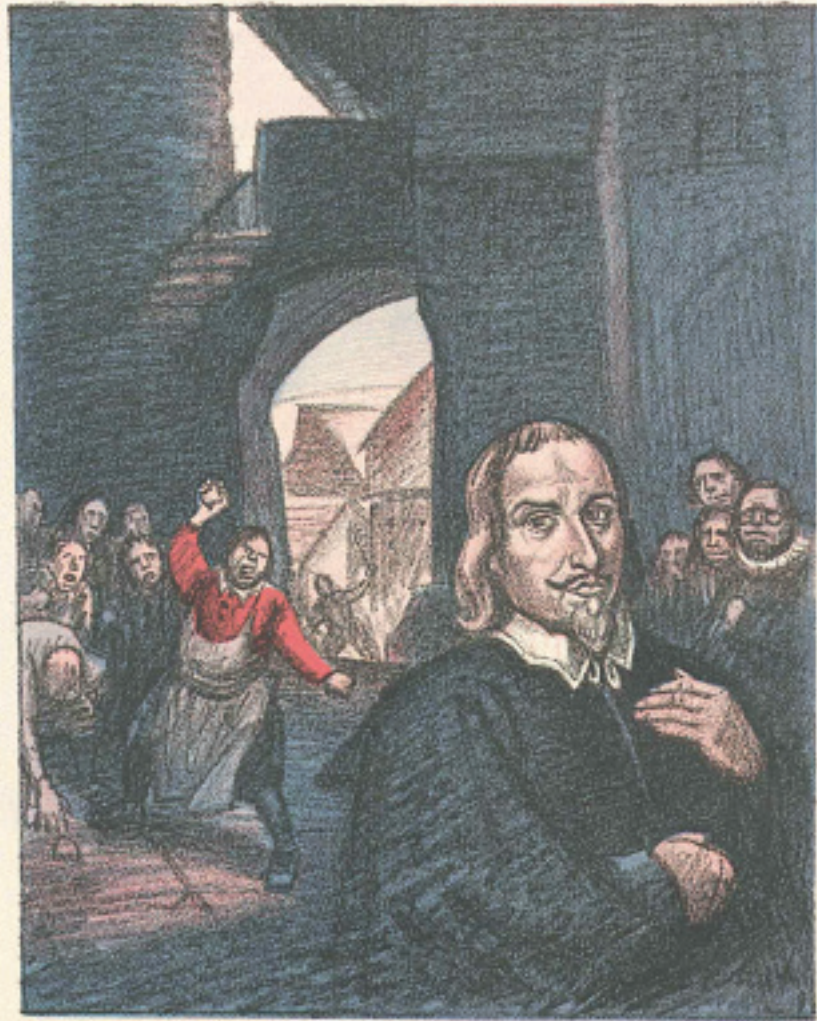
Wilhelm Schulz, Zeichnung in Simplicissimus , 1924, Jahrgang 29, Heft 35, Seite 472