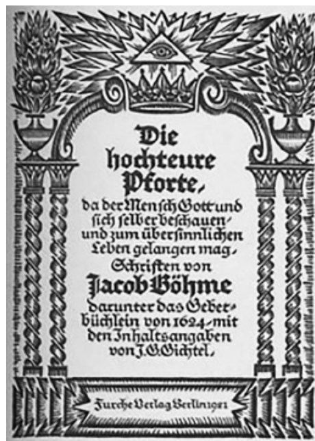
Die hochteure Pforte, Furche Verlag / F. Bruckmann, Berlingen, Berlin, München, 1921

Böhme starb 1624. Seine letzten Worte waren: „Jetzt gehe ich ins Paradies ein.“ Er gründete weder eine Sekte noch einen Geheimbund; dazu war er zu sehr in sich gekehrt und zu weltabgeschieden. Statt Schüler um sich zu scharen und an die Erwerbung von Ruhm zu denken, liess er, gleich der Sonne, sein Licht unbewusst leuchten, unbekümmert darum, ob es fruchtbaren oder unfruchtbaren Boden beschien. Aber eine Engländerin namens Jane Lead stiftete am Ende des 17. Jahrhunderts die „Philadelphier“ („Engelsbrüder“), eine Gesellschaft, die auf Böhmes Lehren fusste, sich jedoch mehr mit leeren Visionen abgab und weder wissenschaftliche noch religiöse Ergebnisse zeitigte. Diese Vereinigung bestand bloss etwa sieben Jahre und ihre Mitglieder hatten nur sehr nebelhafte Vorstellungen von der Tragweite und dem wahren Sinn der Schriften ihres grossen Leitsterns.