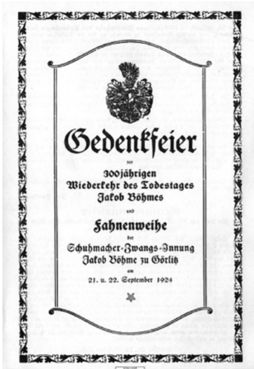
Schuhmacher-Zwangs-Innung, Gedenkfeier zur 300jährigen Wiederkehr des Todestages Jakob Böhmes