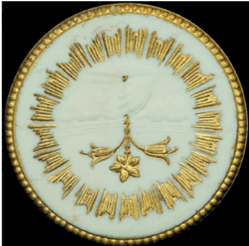
Porzellan-Medaille zum 300. Todestag Jakob Böhmes, Meissen, 1924