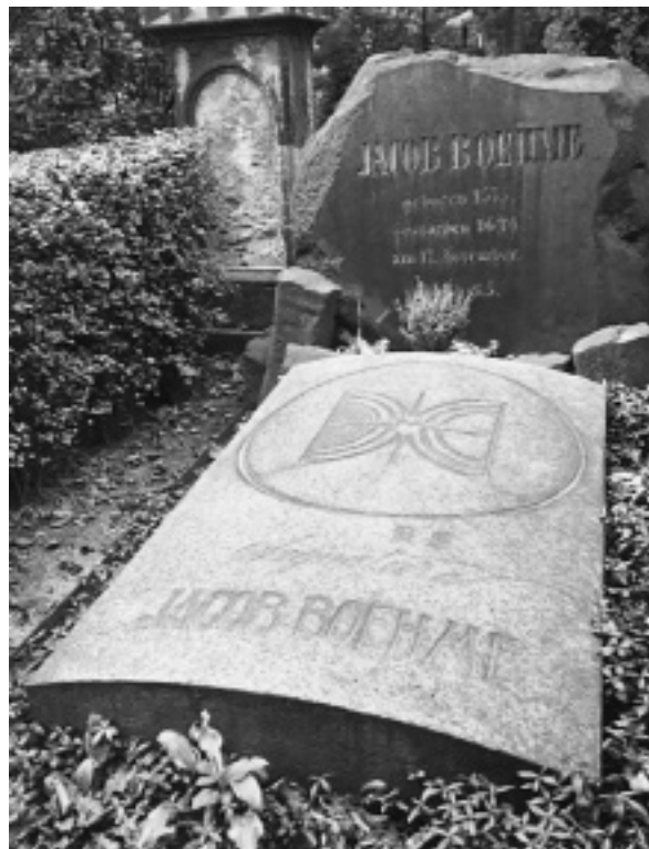
Grabmal Jakob Böhmes, Nikolajfriedhof Görlitz, 1966

Erschienen im Feuilleton der Münchener Nachrichten, 1924