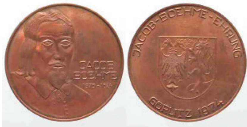
Jacob Boehme-Ehrung, Medaille, Görlitz, 1974

Ganz im Zeichen der in den kommenden Jahren folgenden „Jubiläen“ stehen natürlich auch unsere seit Februar 2020 erscheinenden Magischen Blätter, die ein aus unserer Sicht einzigartiges und für die Kunstgeschichte bedeutendes Kapitel der Rezeptionsgeschichte Jacob Böhmes in Görlitz wieder zugänglich machen wollen. Auch unser 2011–2015 in Zusammenarbeit mit dem Berliner nootheater entstandener und am 15. Mai 2015 im Gerhart-Hauptmann-Theater in Görlitz uraufgeführter 82-minütiger Film „Morgenröte im Aufgang – hommage à Jacob Böhme“ ist unter diesem Stern zu sehen. Nachdem der Film in der Suhrkamp-Edition nun endgültig vergriffen ist, werden wir im Verlag Magische Blätter noch in diesem Jahr eine neue Edition auf DVD und Bluray vorlegen.