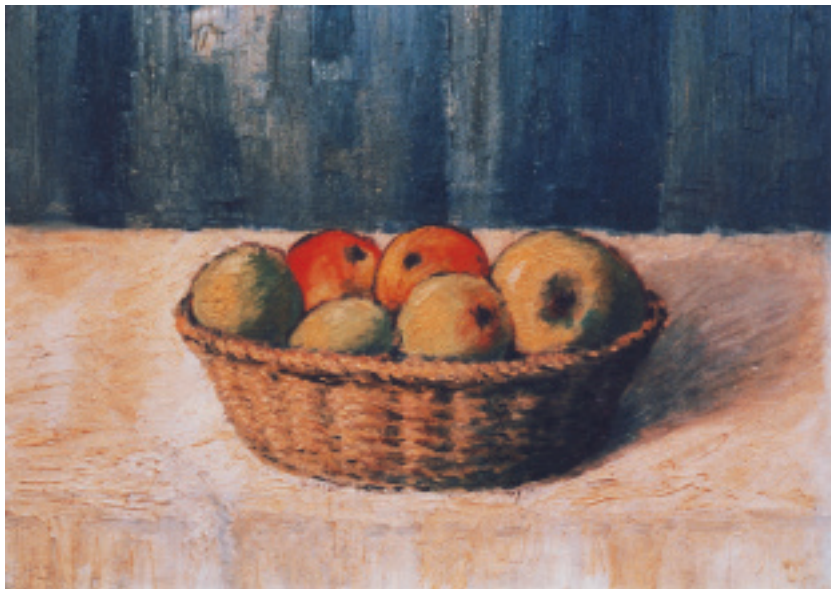
Joseph Schneiderfranken, Apfelkorb, Öl auf Leinwand