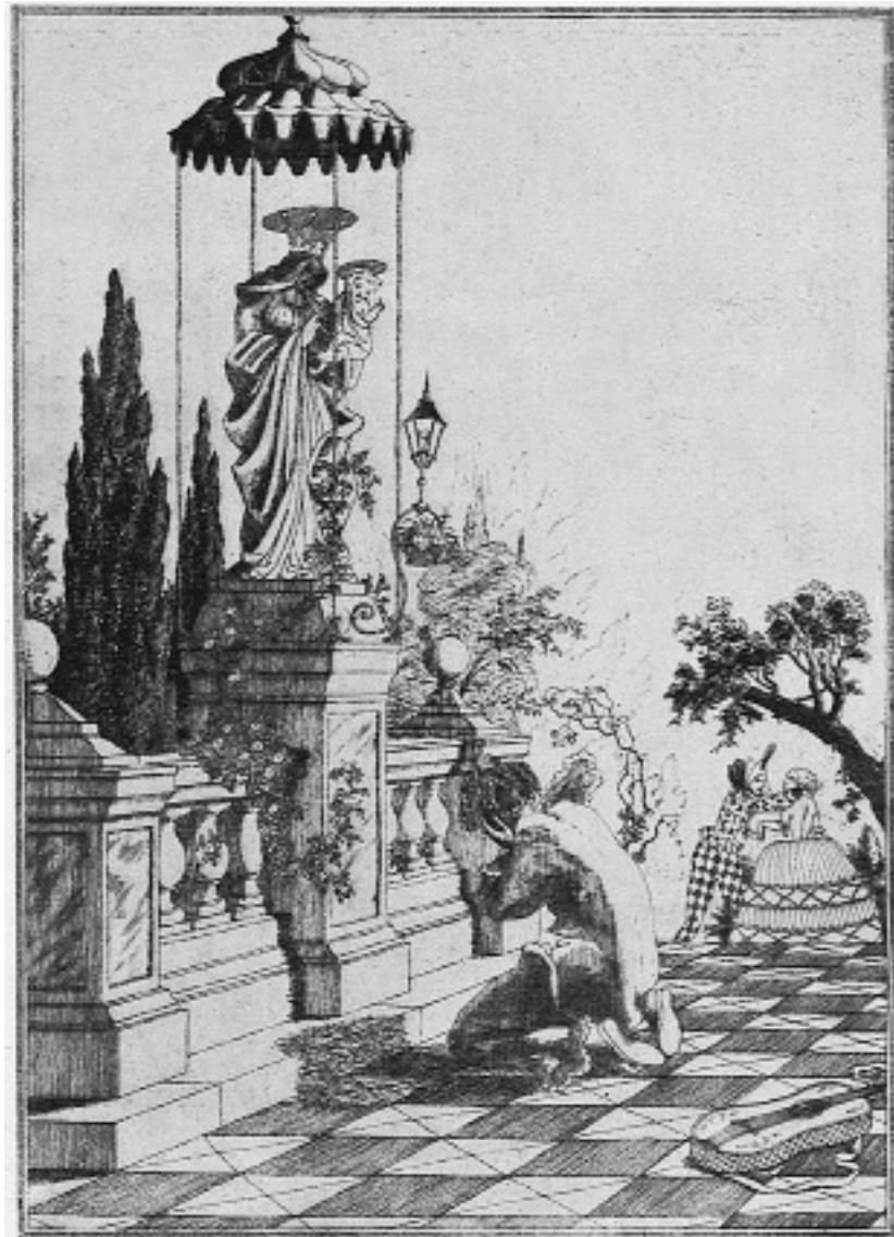
Rolf Schott, Aus dem Zyklus „Pierrot“, Radierung, in: Die Kunst für alle/ Malerei, Plastik, Graphik, Architektur — Heft 1/2, S. 476, 1. Oktober 1916