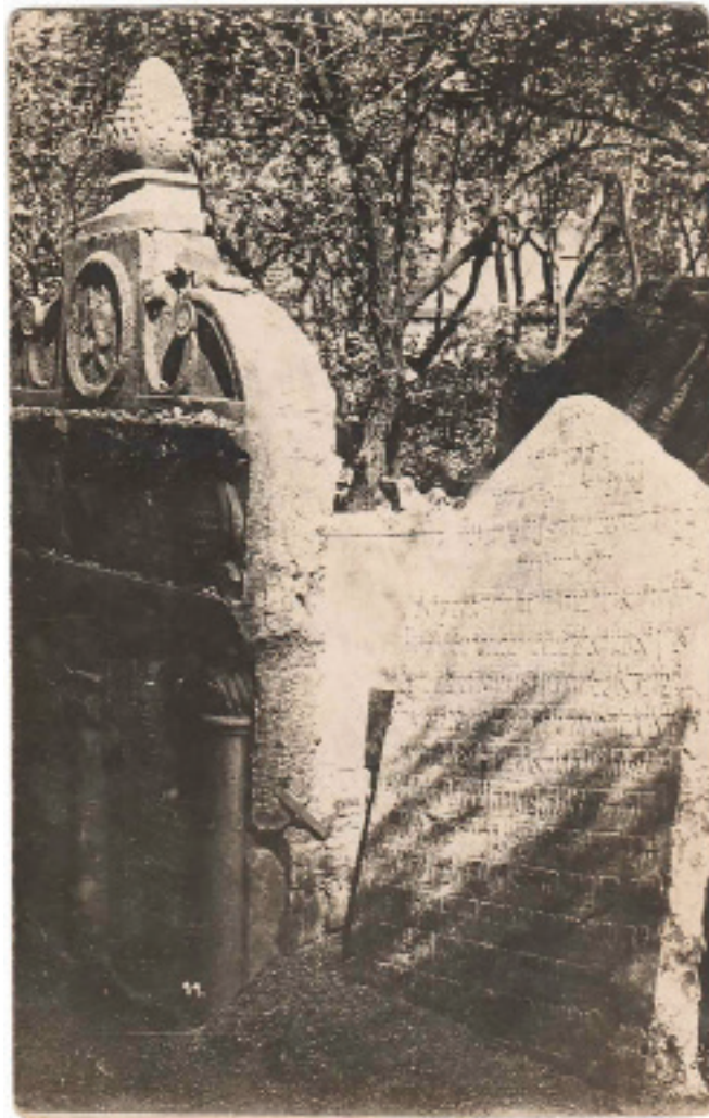
Das schlichte Grab von Rabbi Loen, der Sage nach der Schöpfer des Golem, kann bei einem Besuch des alten Jüdischen Friedhofs in Prag auch heute noch besichtigt werden, hier um 1900 fotografiert..

Neue Wege: Beiträge zu Religion und Sozialismus, Band 42, 1948