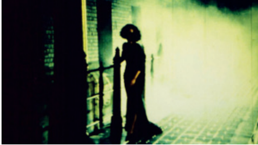
Kalyi-Zeitalter der Finsternis, Regie: Fred Kelemen, Deutschland, Ungarn, 1993