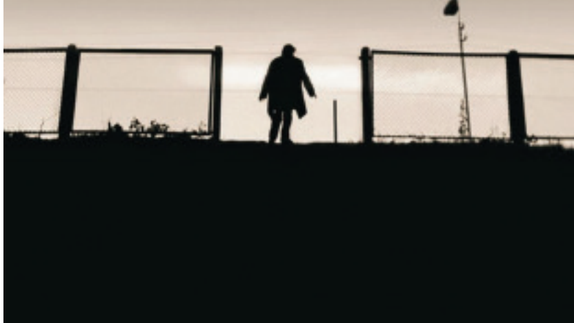
Krišana/Fallen, Regie: Fred Kelemen, Lettland, 2005