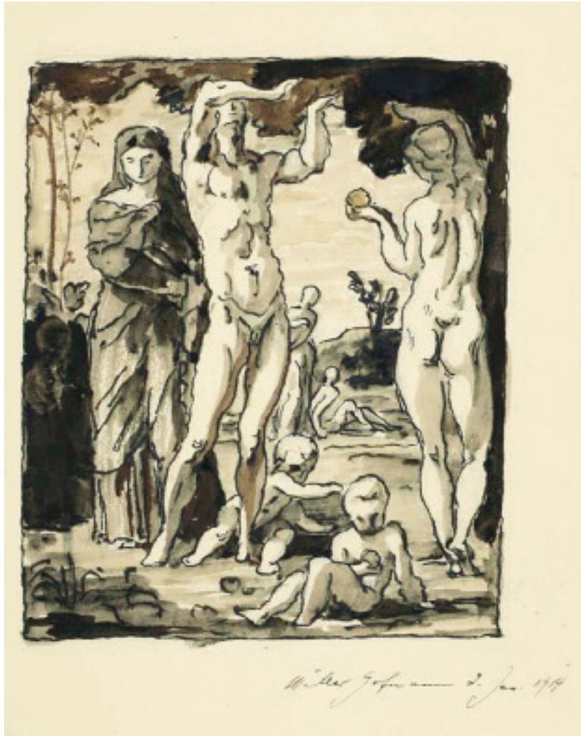
Wilhelm Müller-Hofmann, Gästebuch Schloss Neubeuern, 1914, Bd. V