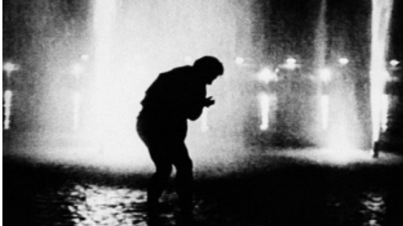
Verhängnis, Regie: Fred Kelemen, Deutschland, 1994