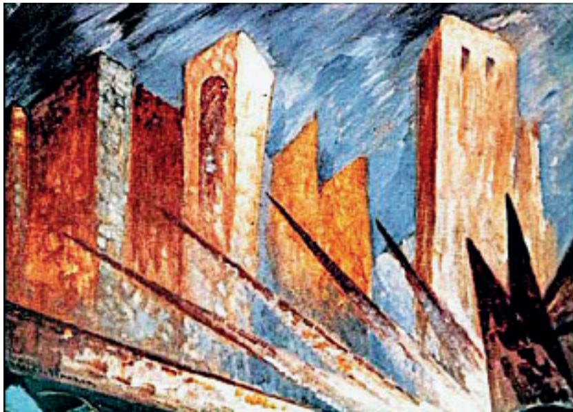
Joseph Schneiderfranken, Fanfare Sodoms, Öl auf Leinwand