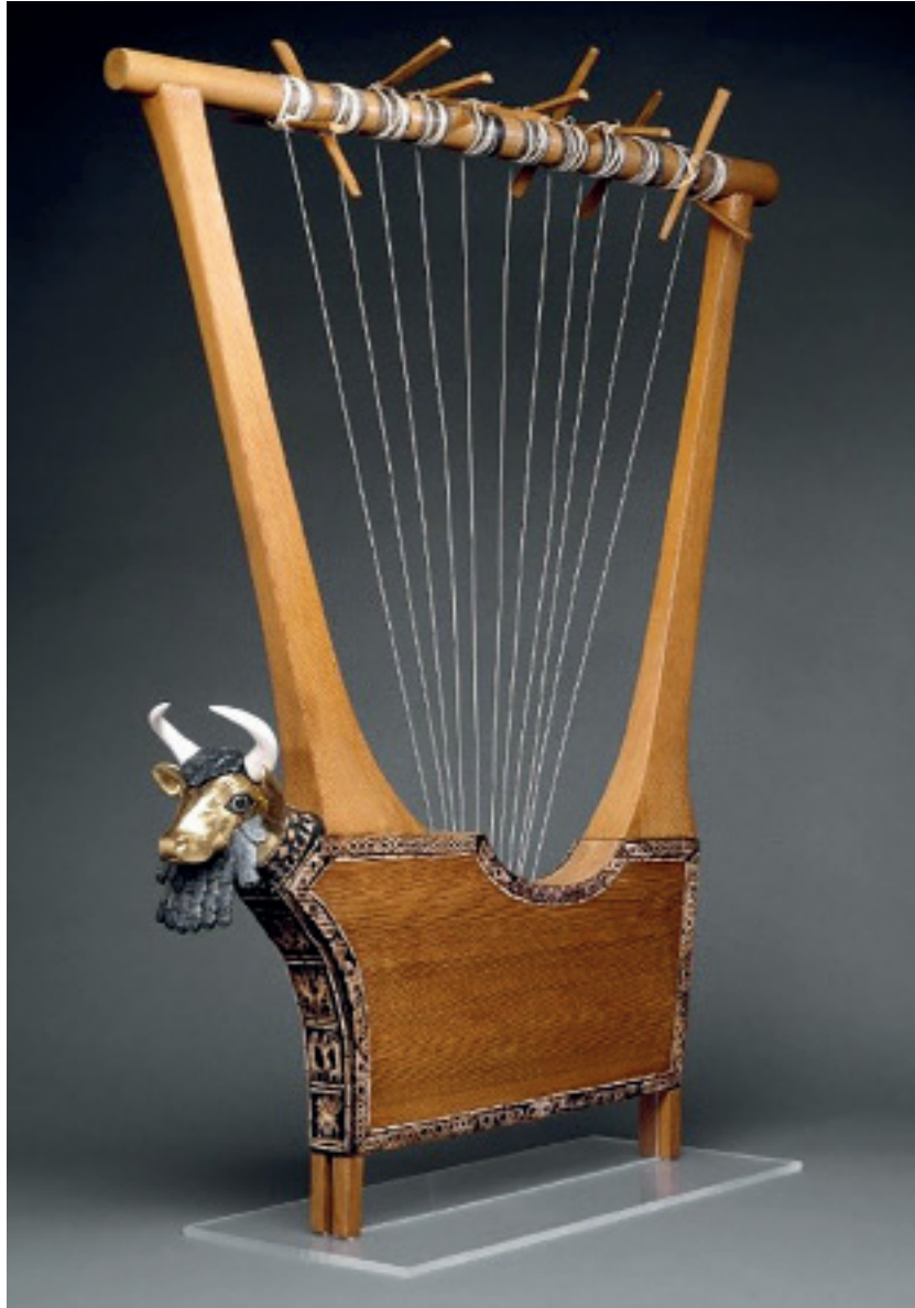
Rekonstruktion der goldenen Leier aus dem Königsfriedhof von Ur, I. Dynastie von Ur, um 2450 v. Chr