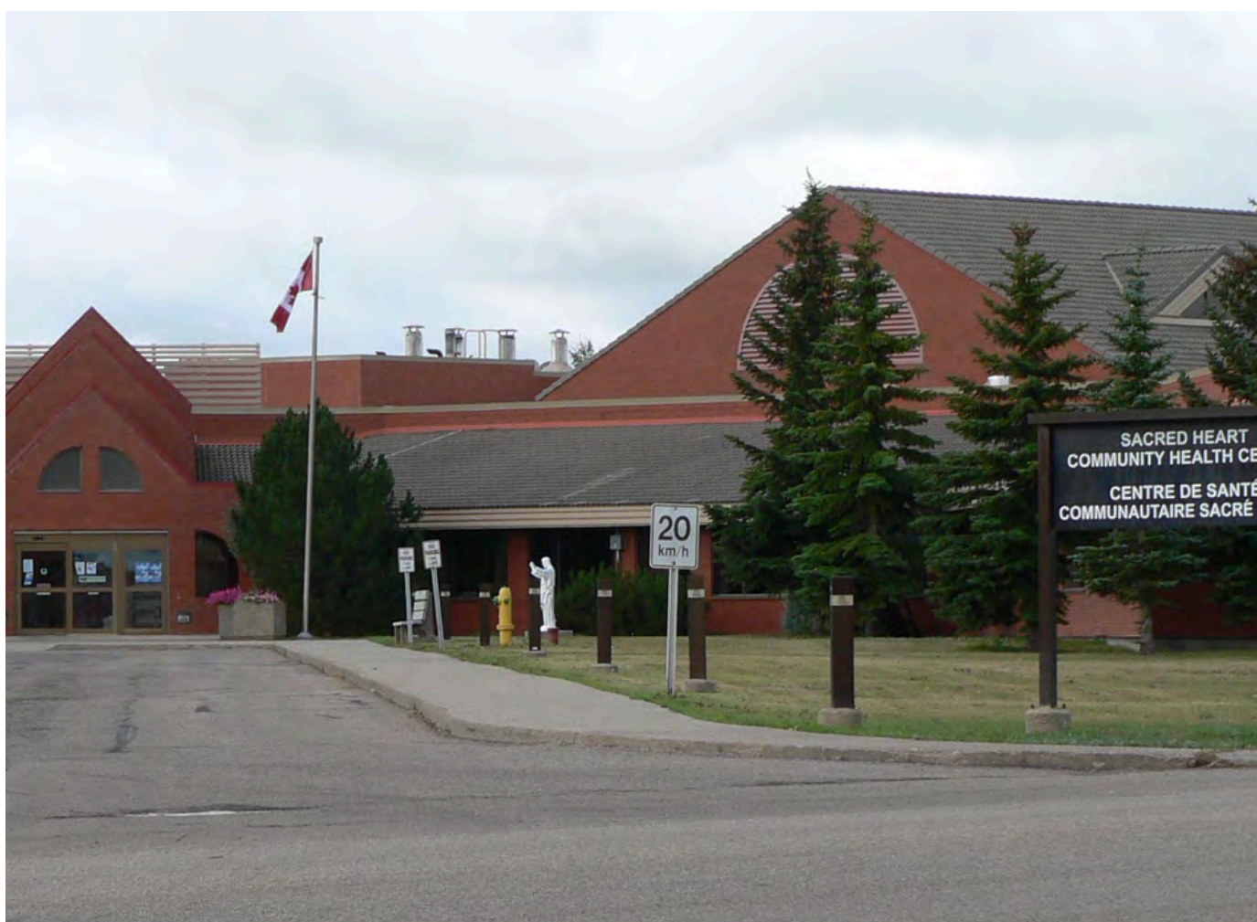
Centre de Santé Communautaire du Sacré-Cœur, McLennan, AB

Cette combinaison de soins de proximité et d'accès régional est un atout majeur de la vie dans la région de Smoky River. Elle permet aux résidents de conserver un mode de vie rural tout en ayant accès à un système de santé plus étendu en cas de besoin.