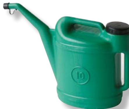
Polietilene alta densità HDPE