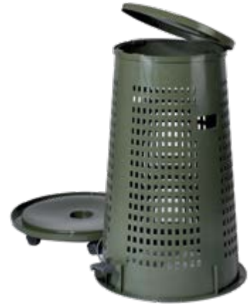
Polietilene alta densità HDPE