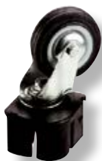
Polietilene bassa densità LDPE.