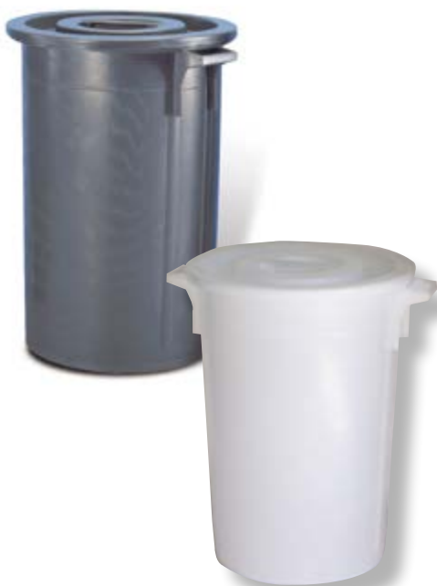
Polietilene bassa densità LDPE