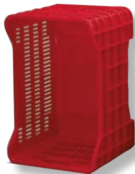
Polietilene alta densità HDPE