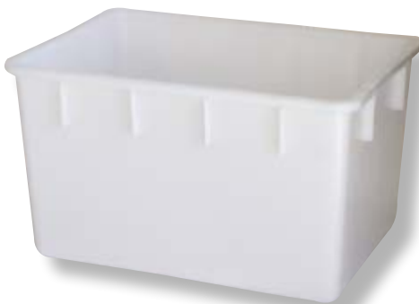
Polietilene bassa densità LDPE.