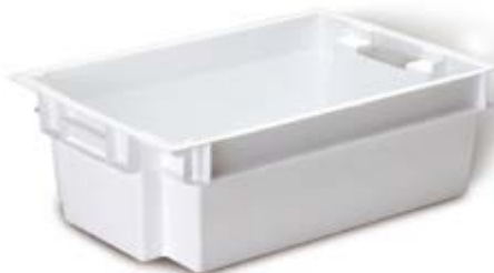
Polietilene alta densità HDPE.