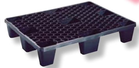
Polietilene alta densità HDPE