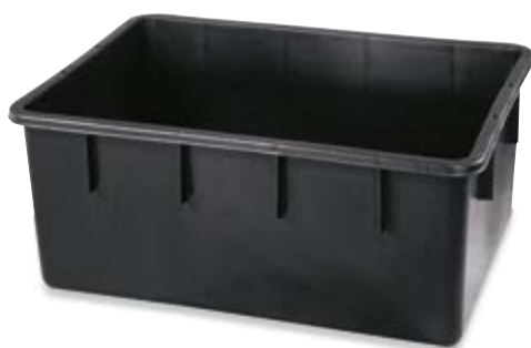
Polietilene bassa densità LDPE.