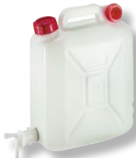
Polietilene alta densità HDPE