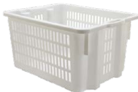
Polietilene alta densità HDPE