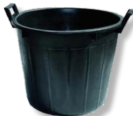
Polietilene bassa densità LDPE