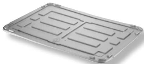
Polietilene alta densità HDPE.