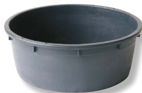
Polietilene bassa densità LDPE