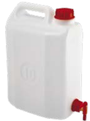
Polietilene alta densità HDPE