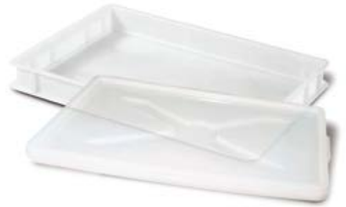
Polietilene alta densità HDPE