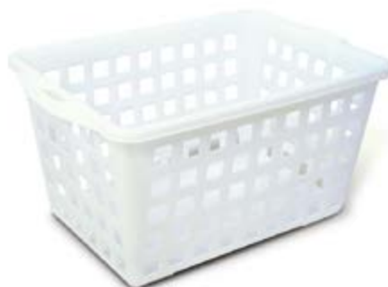
Polietilene bassa densità LDPE