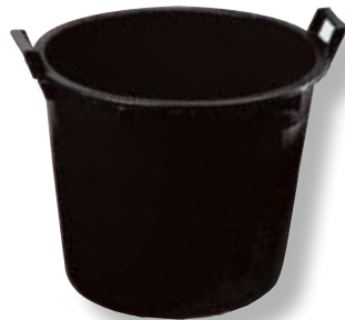
Polietilene bassa densità LDPE