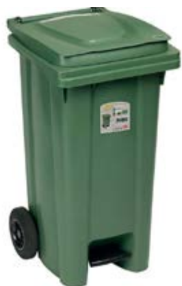
Polietilene bassa densità LDPE