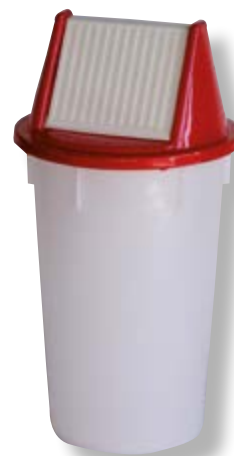
Polietilene bassa densità LDPE