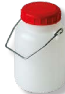
Polietilene alta densità HDPE