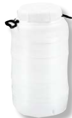
Polietilene alta densità HDPE