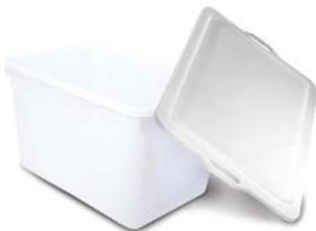
Polietilene bassa densità LDPE