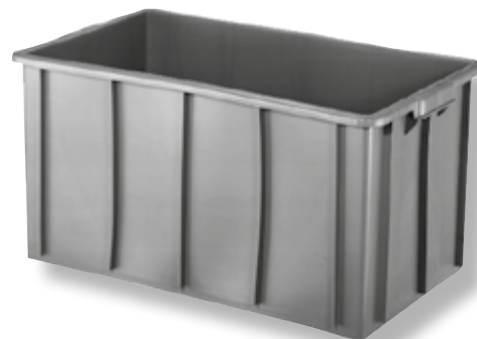
Polietilene alta densità HDPE.