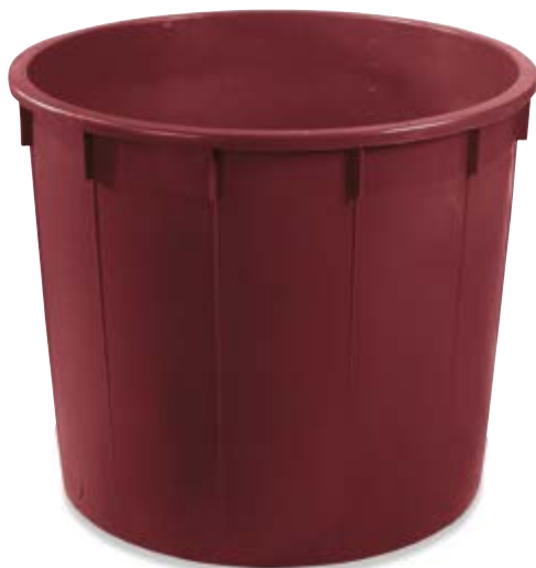
Polietilene bassa densità LDPE