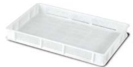
Polietilene alta densità HDPE