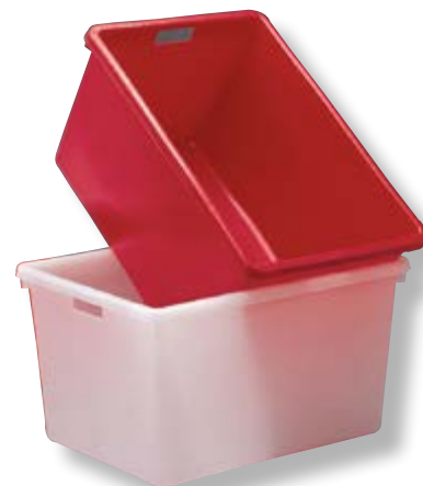
Polietilene bassa densità LDPE