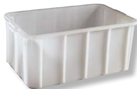
Polietilene alta densità HDPE.