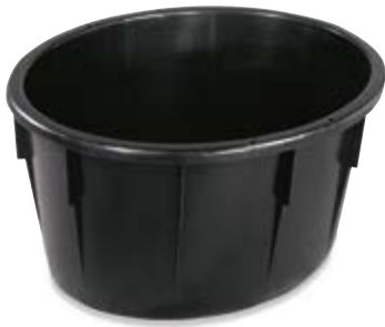
Polietilene bassa densità LDPE