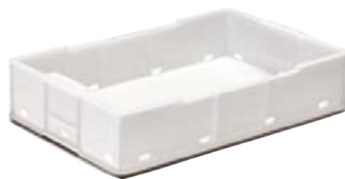
Polietilene alta densità HDPE.