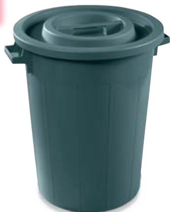
Polietilene bassa densità LDPE