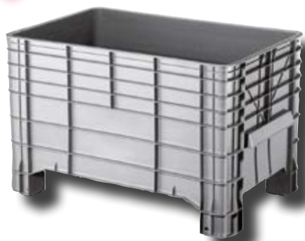
Polietilene alta densità HDPE.