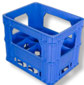
Polietilene alta densità HDPE