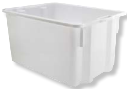
Polietilene alta densità HDPE