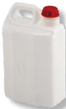
Polietilene alta densità HDPE