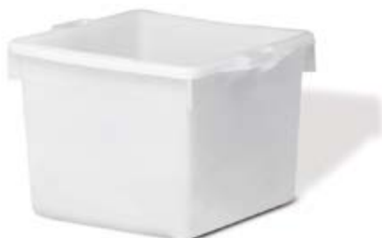
Polietilene bassa densità LDPE