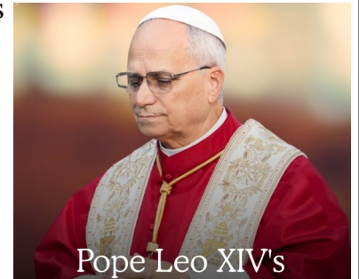
Pope Leo XIV's

Oremos por los sacerdotes que atraviesan momentos de crisis en su vocación, para que encuentren el acompañamiento que necesitan y que las comunidades los apoyen con comprensión y oración.