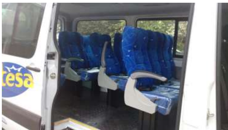
Interior Sprinter de 15 Pasajeros