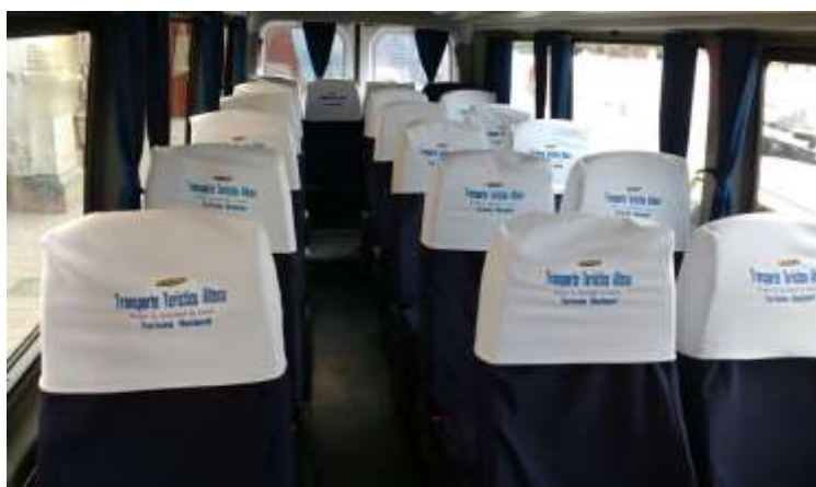
Interior de Sprinter de 19 Pasajeros