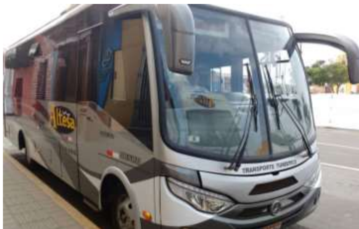
Exterior de Bus Mercedes-Benz LO-915 29 pasajeros