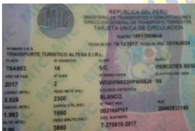
Mercedes-Benz Sprinter de 15 pasajeros T8A-953