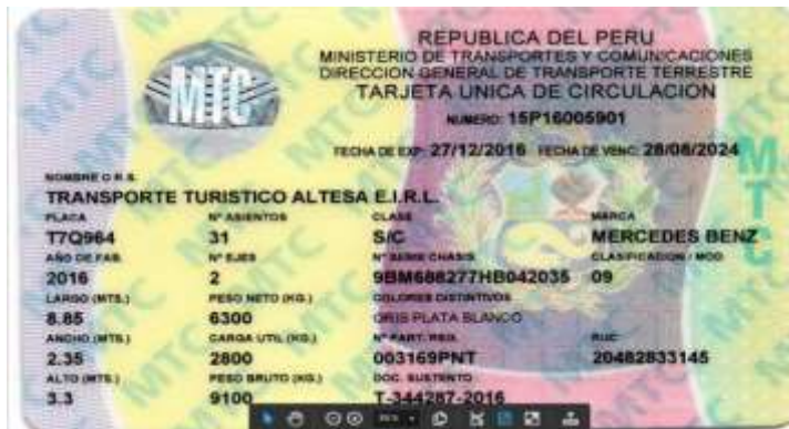
Mercedes-Benz LO-915 de 29 pasajeros

b. Fotografía del exterior e interior de los vehículos