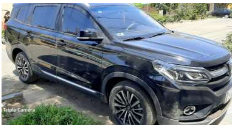
CAMIONETA CERRDA JIM BEI