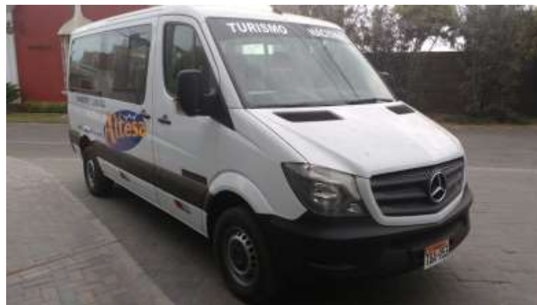
Exterior Sprinter de 15 pasajeros

b. Fotografía del exterior e interior de los vehículos