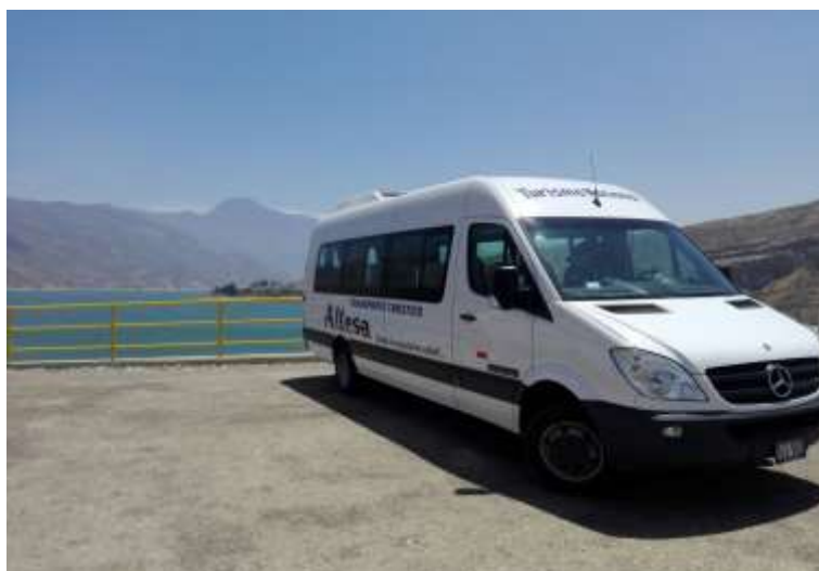
Exterior Sprinter de 19 Pasajeros