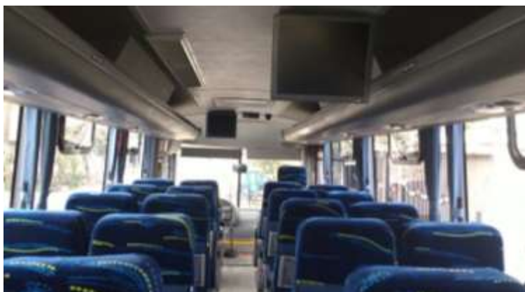
Interior de Bus Mercedes-Benz LO-915 29 pasajeros