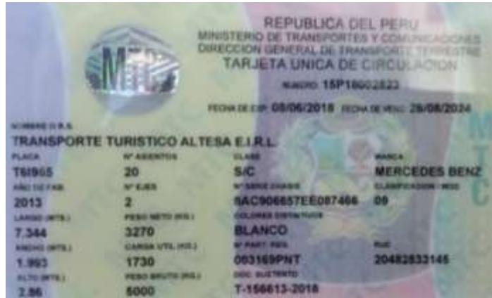
Mercedes-Benz Sprinter 515 de 19 pasajeros