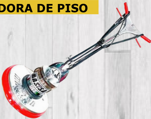
PULIDORA DE PISO