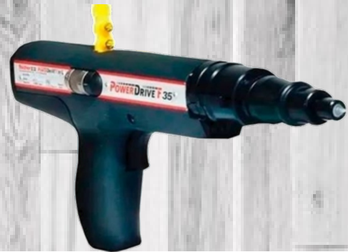
PISTOLA DE FIJACIÓN