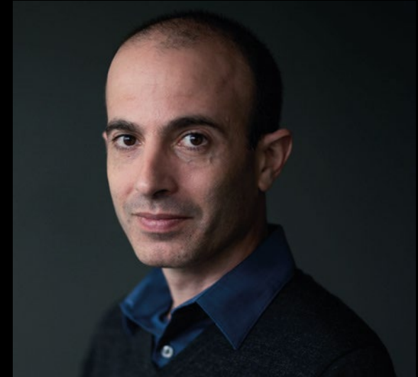
YUVAL NOAH HARARI

Doutor pela Escola de Comunicações e Artes da USP. Autor de mais de 30 livros, como “A vida que vale a pena ser vivida”, “Ética e vergonha na cara!” e “A felicidade é inútil”. Pesquisador e Consultor em Ética da UNESCO. Mestre em Ciência Política pela Université Sorbonne Nouvelle de Paris. Especialista em Direito Constitucional e em Sociologia do Direito pela Université Panthéon-Assas de Paris. Bacharel em Jornalismo pela Faculdade Cásper Líbero de São Paulo e em Direito pela USP.