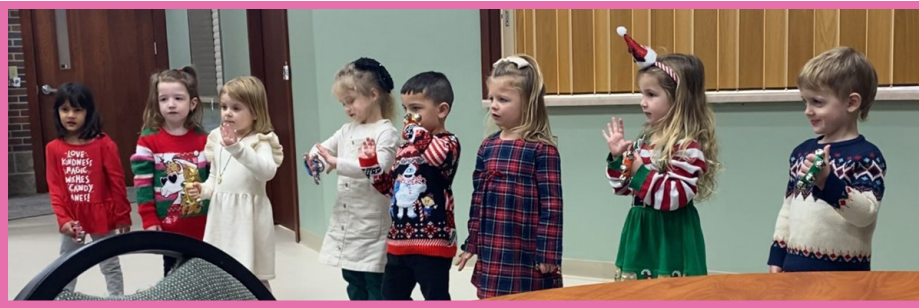
Preescolar en OLV