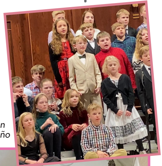
Parte de los alumnos de OLV en el programa navideño