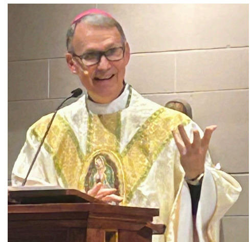
Obispo Patrick Neary

"Mis años en África y en el ministerio parroquial me han mostrado el rostro de Cristo en los pobres y los vulnerables", dijo el obispo Patrick. "Llevo conmigo esos encuentros en este nuevo cargo en Catholic Relief