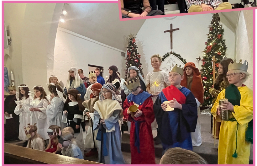
Programa Infantil de Santa Isabel en la Misa del Cuarto Domingo de Adviento