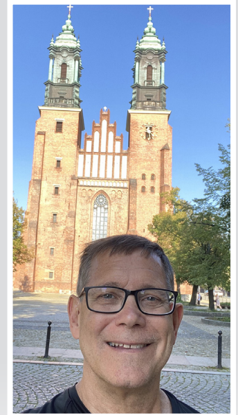
Frente a la catedral en Polonia