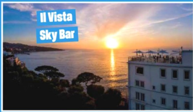
Il Vista Sky Bar