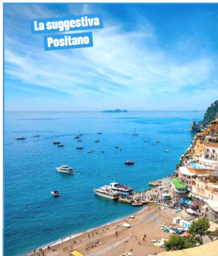
La suggestiva Positano