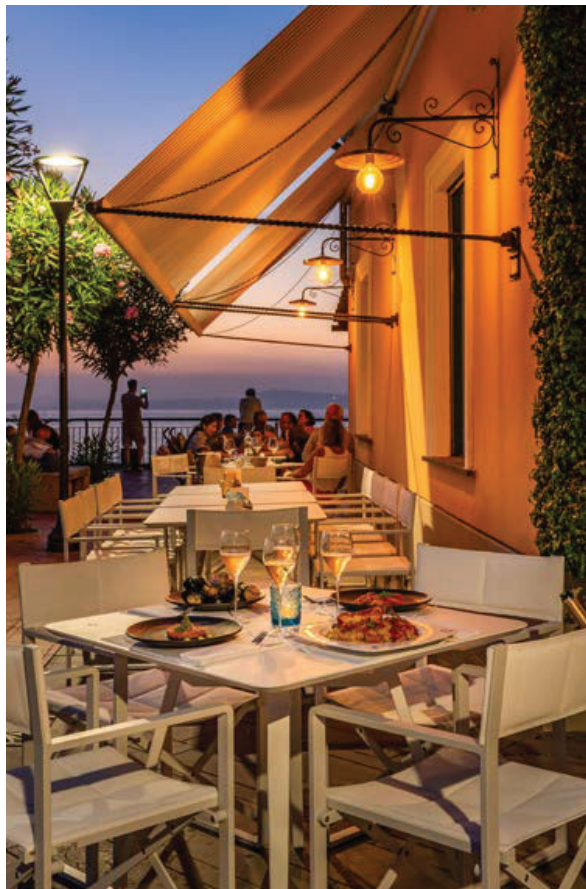
L'ultima novità è il Terrazza Mediterraneo Italian Bistrot, esterno all'hotel, aperto dalle nove del mattino a mezzanotte