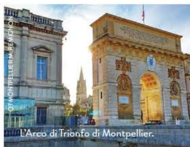
L'Arco di Trionfo di Montpellier.