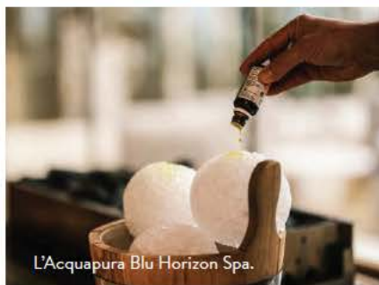
L'Acquapura Blu Horizon Spa.

DALLA MOSTRA BANKS & RIE - DS: L'ARTE DELLA RIBELLIONE al JMuseo (fino al 15/09) agli show di B.A.M - Beach Art Music (fino al 4/09), dai tornei della Beach Arena ai mercatini sotto le stelle: l'estate a Jesolo è tutta un evento. Passeggiare nella città sull'Adriatico è anche un tour a cielo aperto di architettura e cinema: il piano urbanistico è di Kenzo Tange, il Falkensteiner Hotel & Spa di Richard Meier, la torre è di Gonçalo Byrne e João Ferreira Nunes mentre l'hotel Casa Bianca al Mare , edificio moresco del 1920, è stato il set di Signore e signori (1966) con Virna Lisi e dimora di star come i Rolling Stones. Per lo shopping c'è l' isola pedonale più lunga d'Europa, oltre 10 km con 1.200 boutique, per un tuffo ci sono 15 chilometri di spiagge . jesolo.it