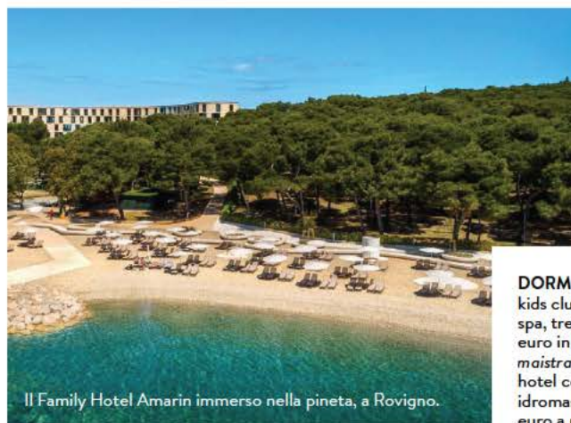
Il Family Hotel Amarin immerso nella pineta, a Rovigno.

scena tour al tramonto con attori che ne ripercorrono le avventure ( casanovavrsar.com ). Per chi viaggia in famiglia, d'obbligo un trekking nel bosco di Kontija , polmone verde di cerri e ginepri, una visita al Canale di Leme , valle sommersa di 12 km stretta in un fiordo tra alte scogliere, e il Dino-park Fontane : è dedicato ai dinosauri e alle orme giganti ritrovate nella penisola. istra.hr