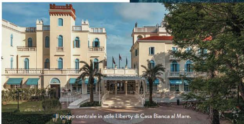
Il corpo centrale in stile Liberty di Casa Bianca al Mare.