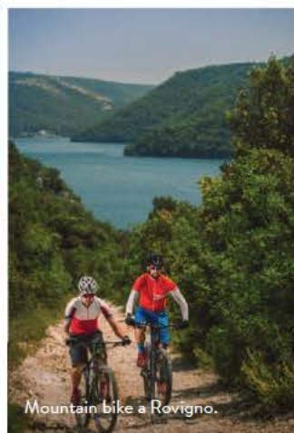
Mountain bike a Rovigno.