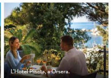
L'Hotel Pineta, a Orsera.

DORMIRE • Family Hotel Amarin : a Rovigno, kids club, spiaggia privata, cinque piscine, spa, tre ristoranti. Doppia con lettino, da 308 euro in pensione completa, minimo 3 notti. maistra.com • Hotel Pineta : a Orsera, bike hotel con due ristoranti, due piscine, una con idromassaggio e spa. Doppia in b&b da 135 euro a notte, minimo 3 notti. maistra.com