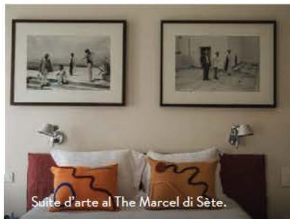
Suite d'arte al The Marcel di Sète.