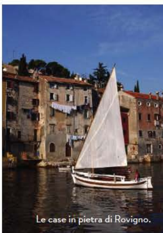
Le case in pietra di Rovigno.