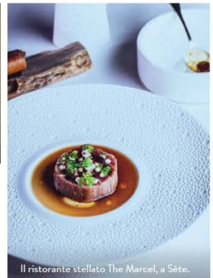
Il ristorante stellato The Marcel, a Sète.