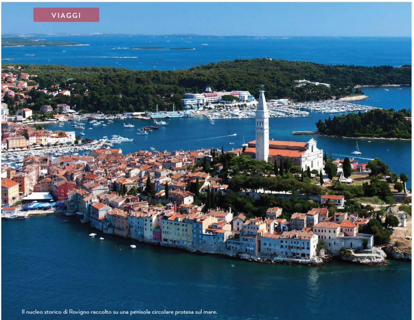
Il nucleo storico di Rovigno raccolto su una penisola circolare protesa sul mare.