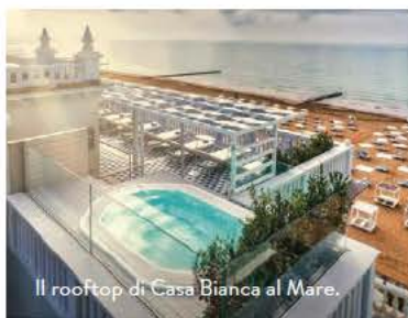
Il rooftop di Casa Bianca al Mare.