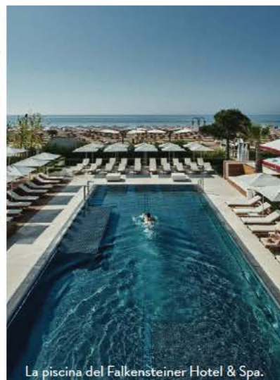
La piscina del Falkensteiner Hotel &amp; Spa.

DORMIRE - Falkensteiner Hotel & Spa Jesolo : Acquapura Blu Horizon Spa, yoga, fitness, beach club, piscina, ristoranti. Doppia in b&b da 256 euro. falkensteiner.com • Casa Bianca al Mare : in stile Liberty, suite vista mare, terrazza, idromassaggio, arte e fine dining. Doppia in b&b da 450 euro. hotelcasabianca.com