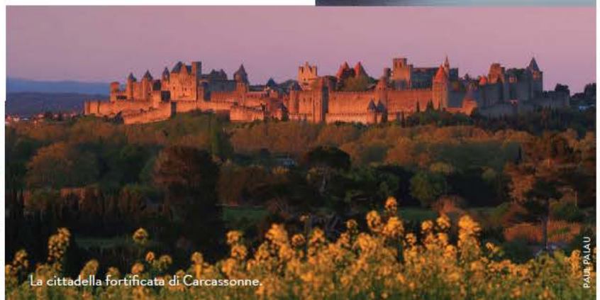
La cittadella fortificata di Carcassonne.