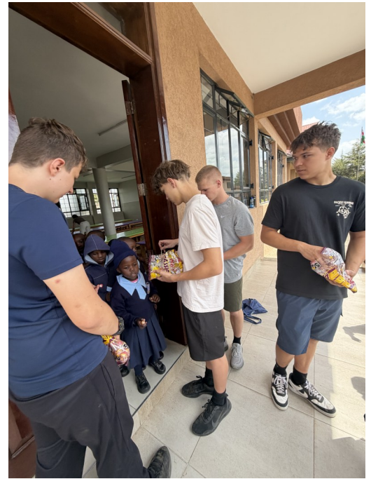
Young people from our parish who, thanks to the support of our parish community, traveled to Nairobi on a missionary trip to serve at the School of Divine Mercy and with the Missionaries of the Poor.